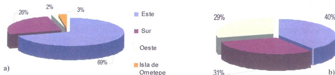
Figura 2. Contribución por vertiente de la carga entrante modelada en relación al uso del suelo al Lago Cocibolca: a) Aporte de fósforo total b) Aporte de nitrógeno total

En la Figura 3 se observa que el 58% de la carga total modelada para ambos nutrientes (equivalentes a 350 \text{ ton P} y 917 \text{ ton N a}^{-1} ) generada por la población, procede de la vertiente Oeste. En áreas donde la población está más dispersa (el sector Sur) se identificaron cargas particularmente bajas.