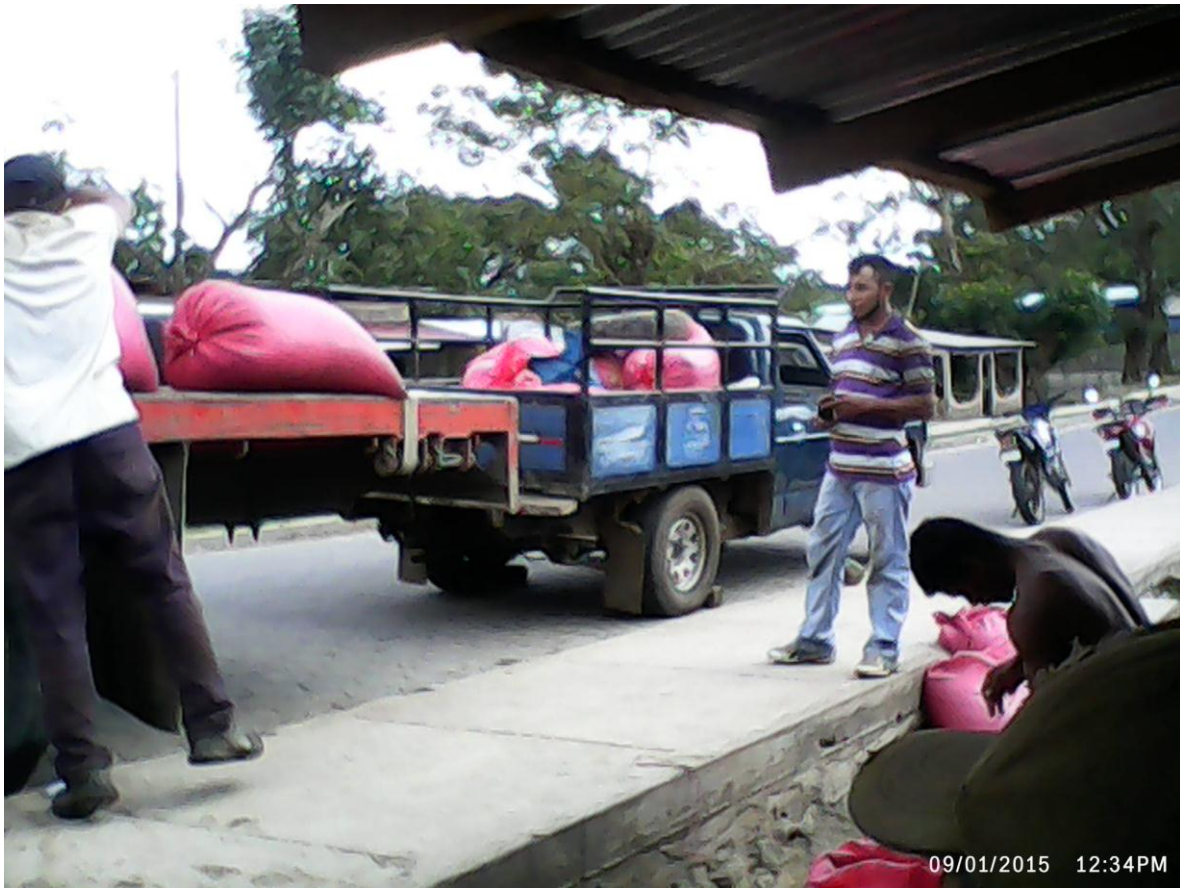
Ilustración 3:

Trabajo en la Producción de café. En la cooperativa Santa Isabelia de Peñas Blanca.