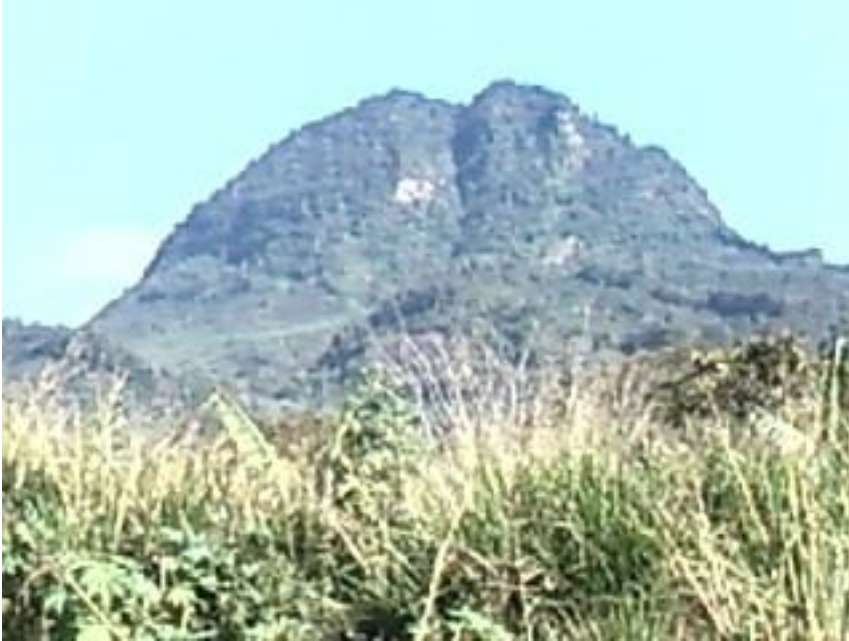
Ilustración 1 Macizo de Peñas Blanca.