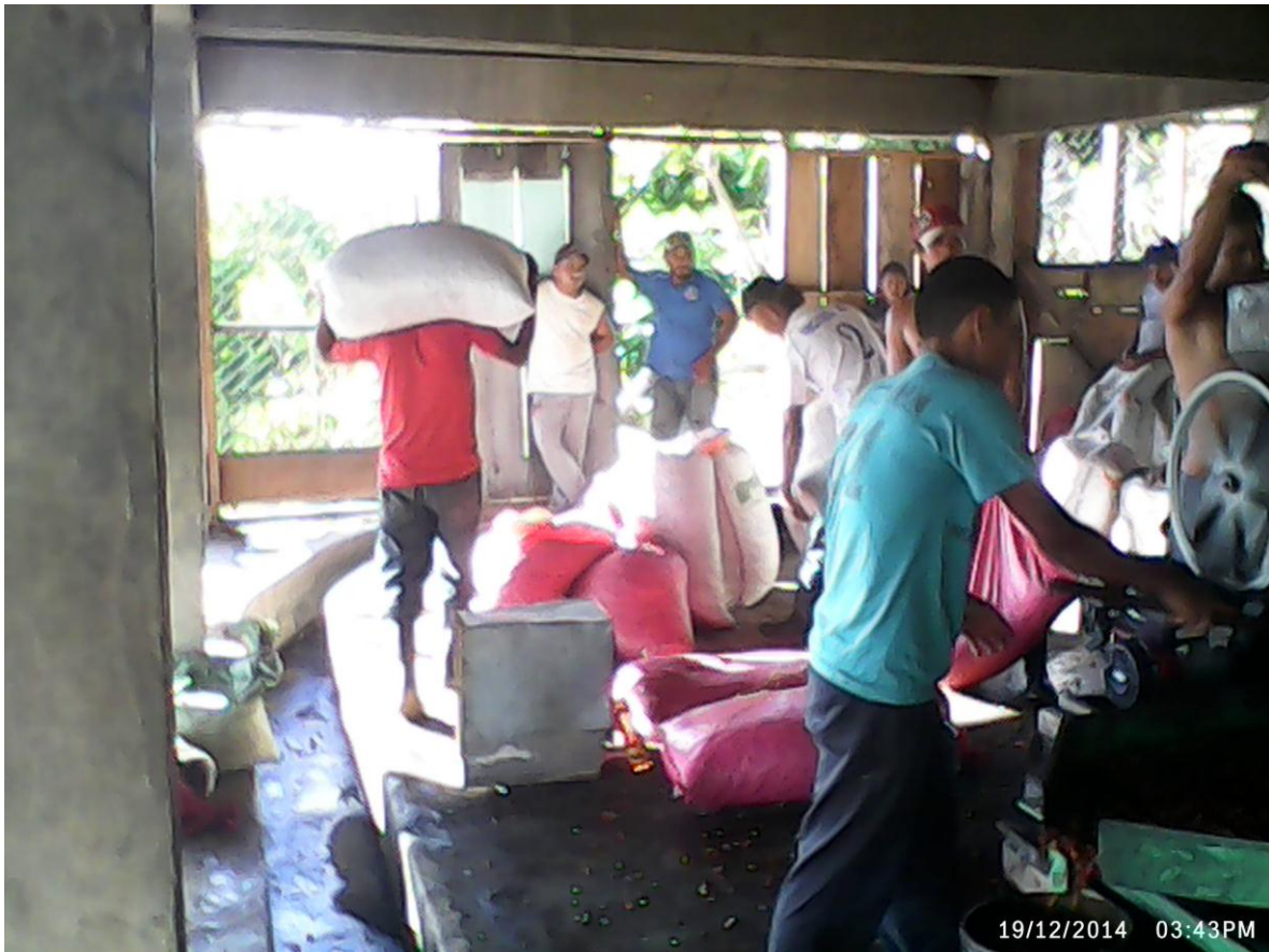
Ilustración 4_ Productores despulpando café.

En esta imagen se esta despulpando café en un beneficio húmedo el la comunidad isla de Peñas Blanca.