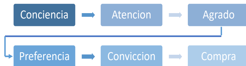
Gráfica 1. Fases de disposición a la compra de consumidor.

En estos casos la empresa debe conseguir convencer a esos consumidores potenciales para dar el último paso, para ello la empresa puede recurrir a precios promocionales especiales, descuentos o bonificaciones. (Armstrong, 2007 P.497)