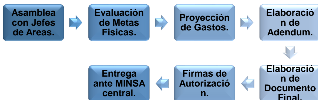
Figura N° 1. Proceso de Planificación del Presupuesto