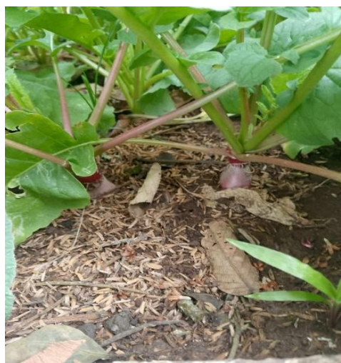
Ilustración 5 cultivo listo para cosechar