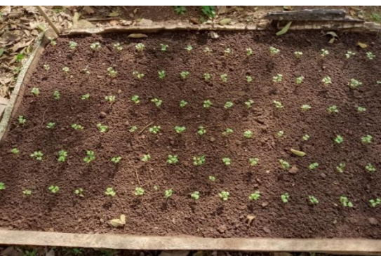
Ilustración 1 Plantula de rábano