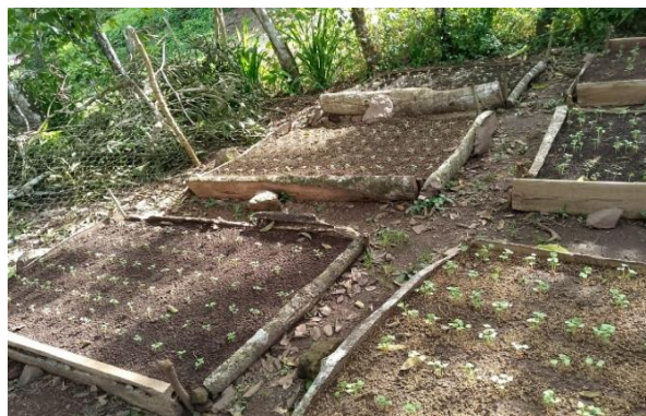
Ilustración 2 bancales