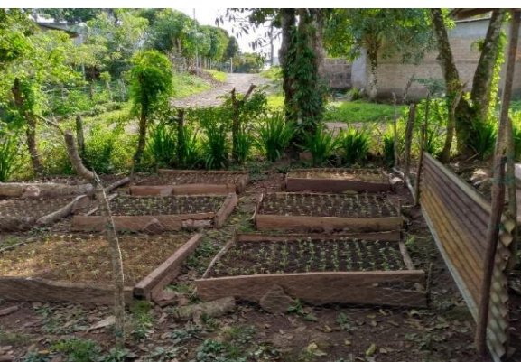
Ilustración 3 repeticiones