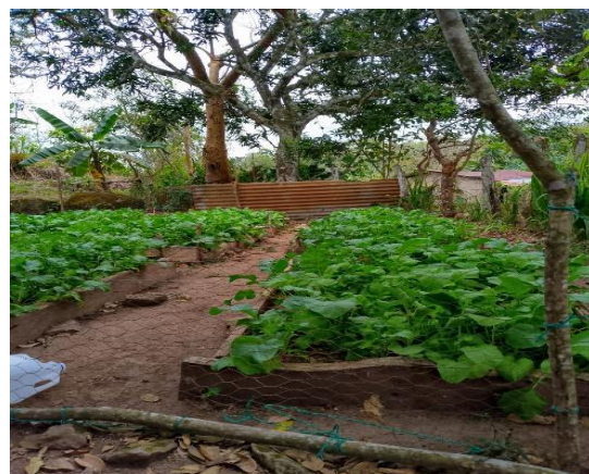
Ilustración 4 desarrollo del follaje