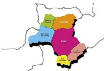
Mapa de división política de Estelí