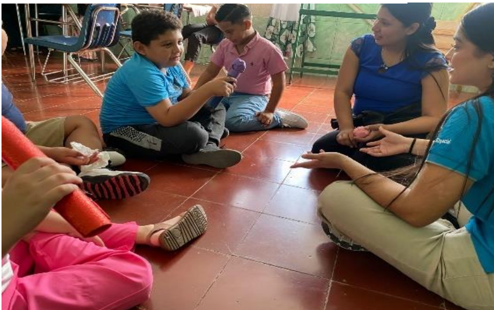
Figura 4 Estrategia mis pequeños periodistas.