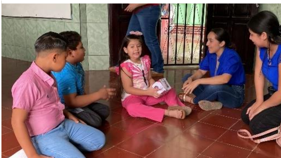
Figura 5 el Dado de las emociones

Permite que los niños identifiquen y expresen sus emociones, fortalece su autocontrol.