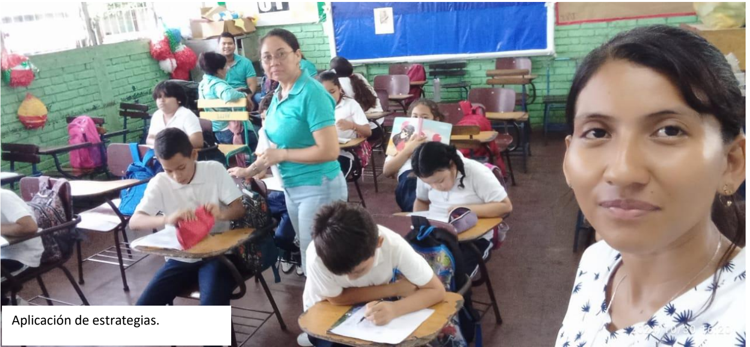
Aplicación de estrategias.