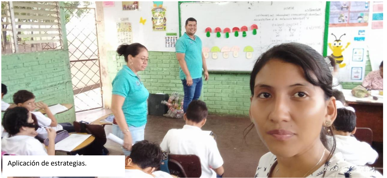
Aplicación de estrategias.