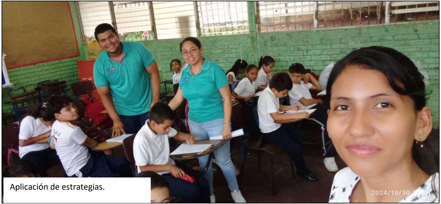
Aplicación de estrategias.