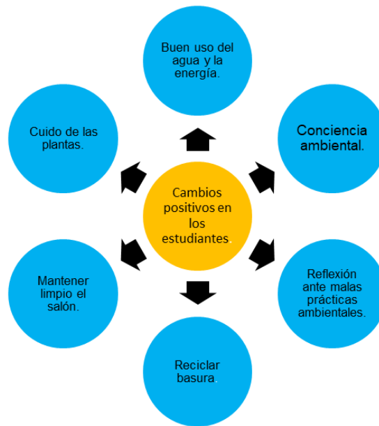
Esquema 8 Cambios positivos.