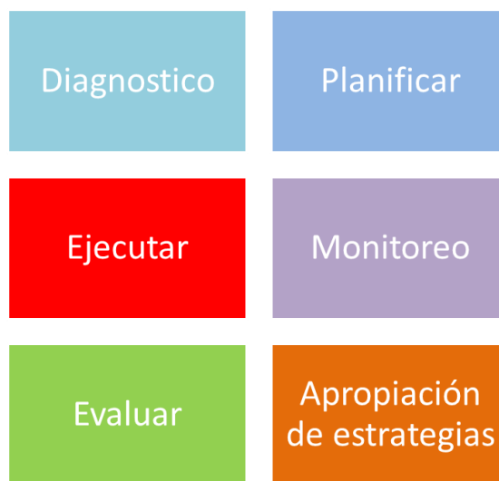
Esquema 6 Pasos para elaborar un plan de gestión. Fuente propia – Obtenida de las entrevistas.

En el siguiente esquema se presentan los pasos que consideran los docentes tomar en cuenta para elaborar un plan de gestión integral del medio ambiente: