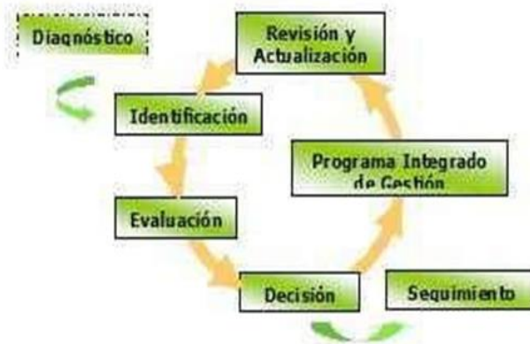
Esquema 5 – Identificación, Evaluación Programa de Gestión