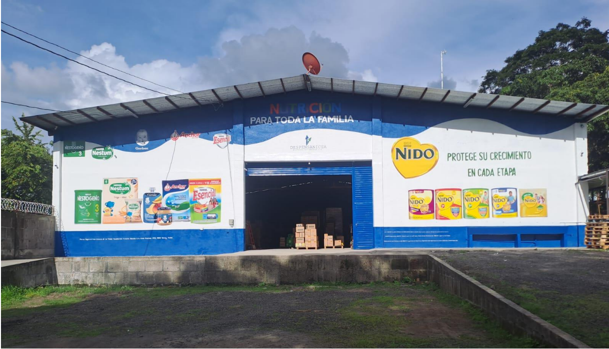
Anexo 4. Empresa DESPENSANICSA.