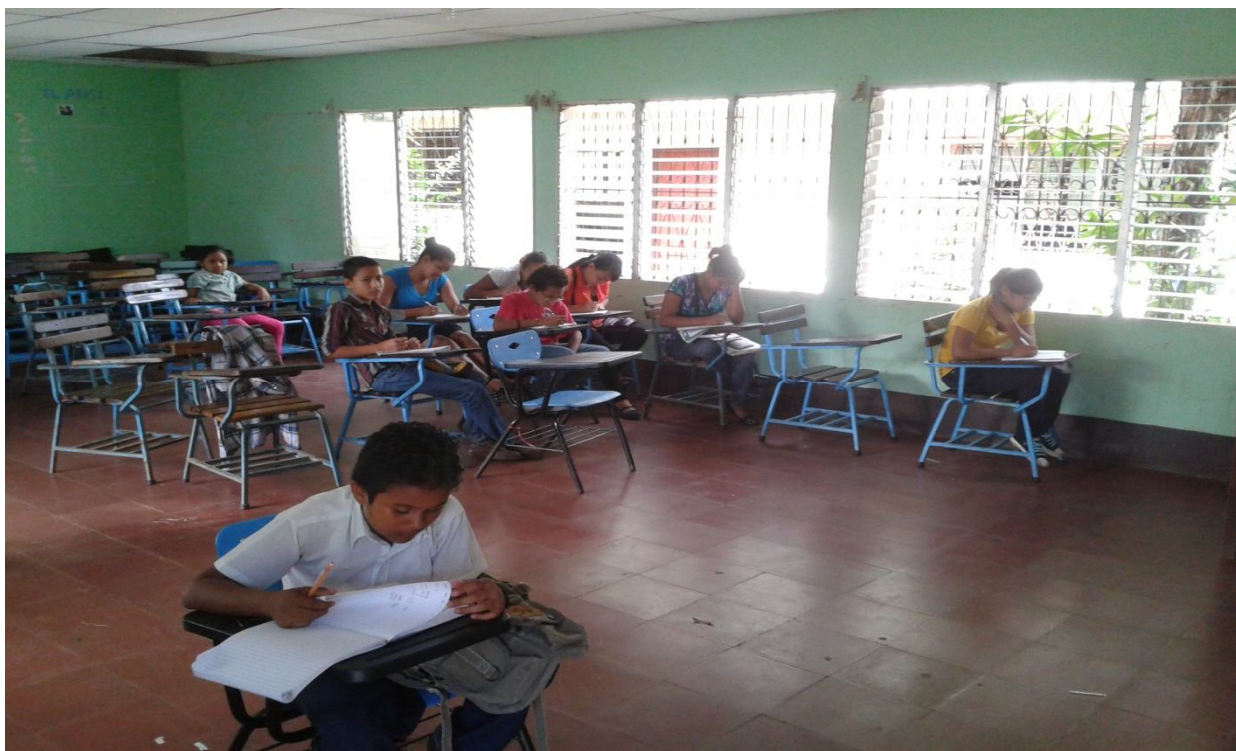
DISCENTES ATENDIENDO LAS ORIENTACIONES DEL DOCENTE.