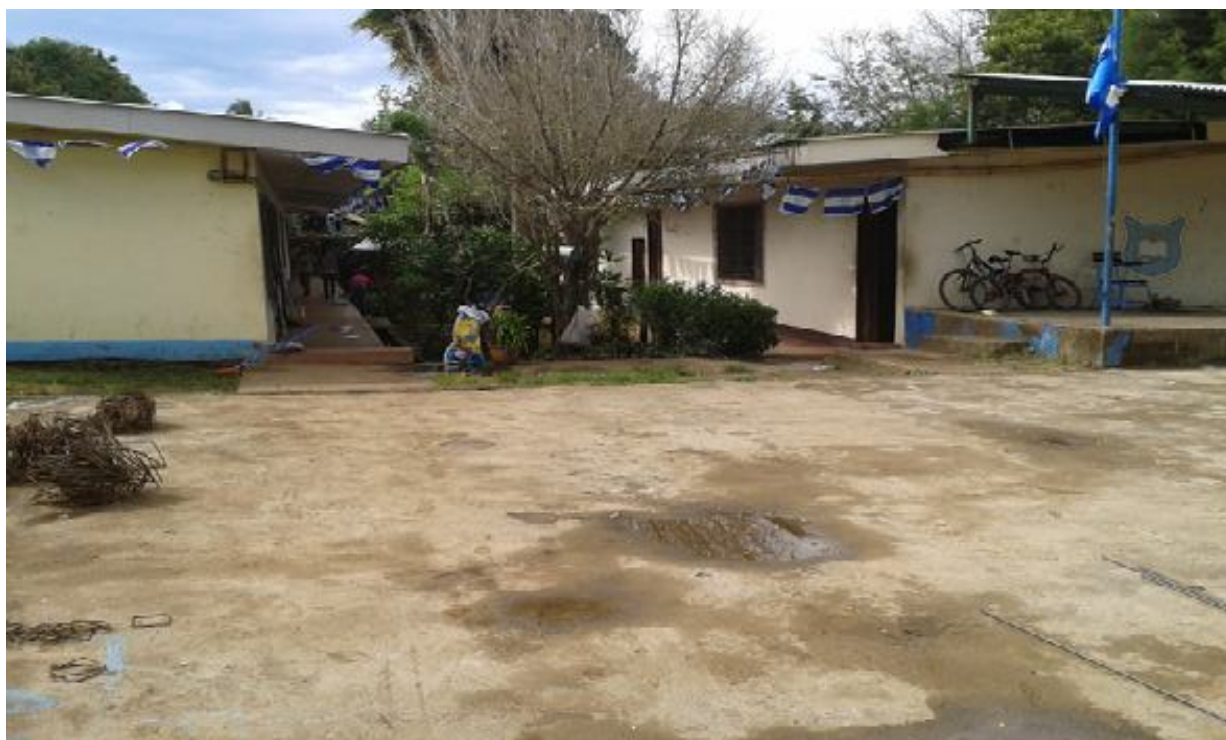
AULAS DE CLASE DEL INSTITUTO RAMÓN MATUS ACEVEDO