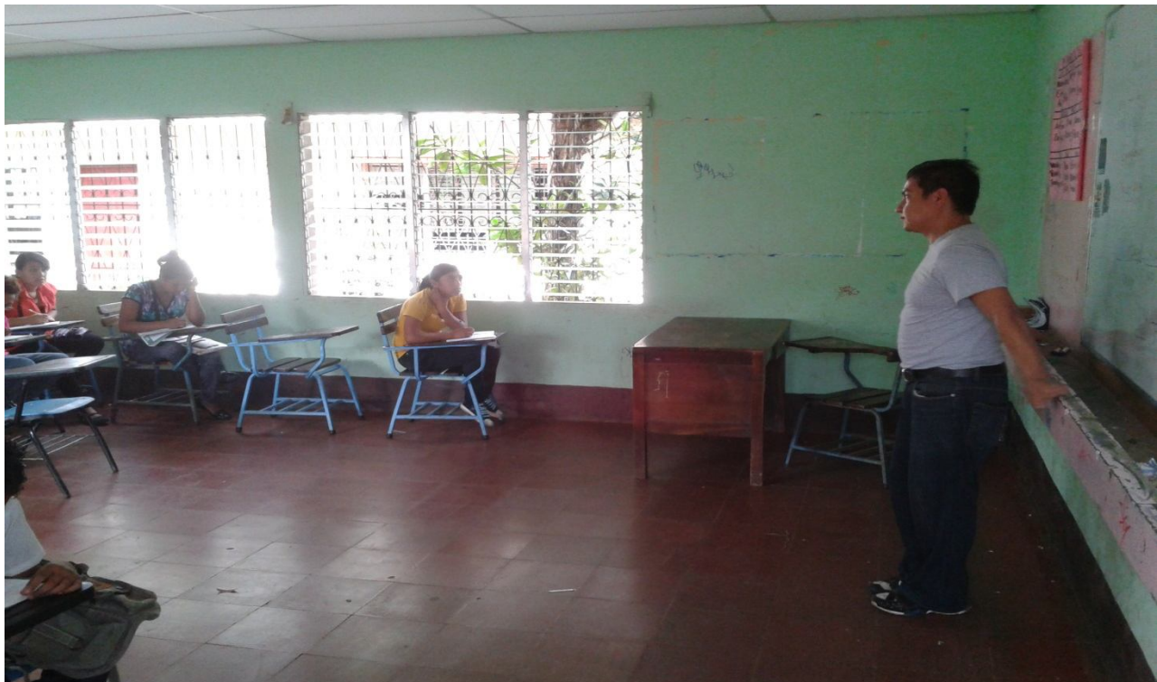
DOCENTE IMPARTIENDO CLASES DE REFORZAMIENTO