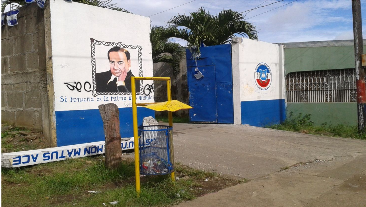
ENTRADA DEL INSTITUTO RAMÓN MATUS ACEVEDO