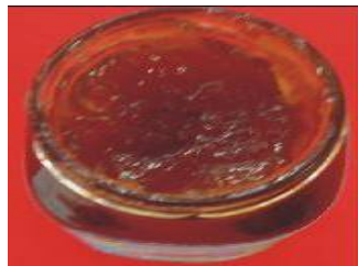
Figura 1 y 2.