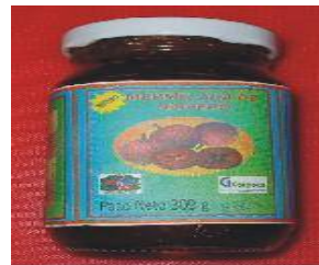
a. Aspecto del producto. b. Producto en envase de vidrio.