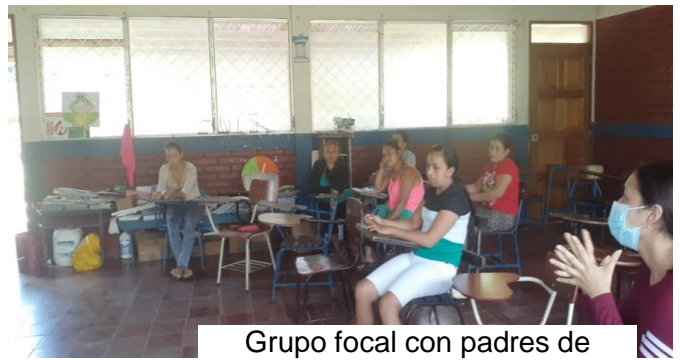
Grupo focal con padres de familia