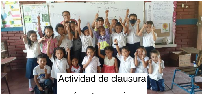
Actividad de clausura