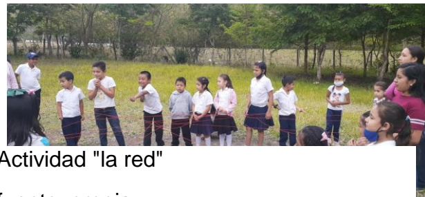
Actividad "la red"