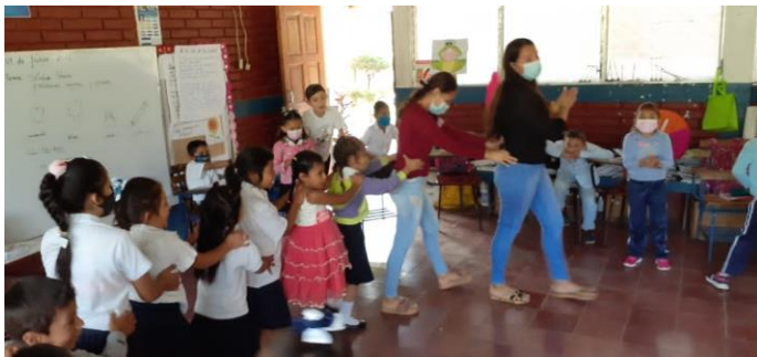
Dinámica lúdica: la culebra