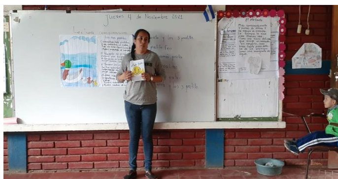
Actividad "Como estoy"