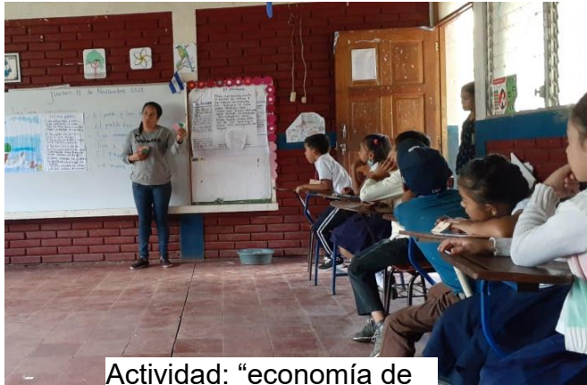
Actividad: "economía de fichas"