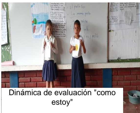
Dinámica de evaluación "como estoy"