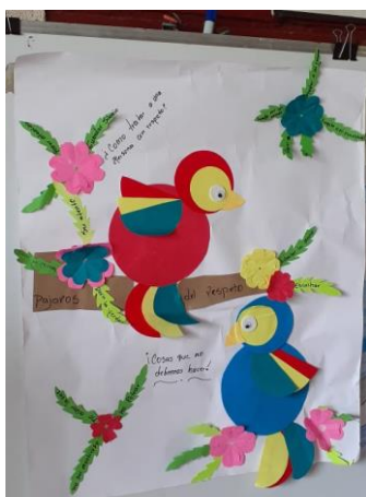
Figura 3. Pájaros del respeto fuente: estrategias

Otra de las estrategias implementadas el 05/09/2022 fue “Pájaros del respeto” con el objetivo de representar las actitudes para tratar a las personas con respeto, en la que en papelógrafos se dibujaron dos pájaros, uno representaría “lo que no se debe hacer para tratar a una persona con respeto” y el otro, “lo que se debe hacer para tratar a una persona con respeto” se procedió a hacer lluvia de ideas con los niños y la docente y obtuvimos como repuestas, por ejemplo; en los que se debe hacer para tratar con respeto a las personas; escucharlas con atención, ayudarle en las tareas, y en lo que no se debe hacer para tratar con respeto a las personas, respondieron: gritar, decir malas palabras, etc. se colocó en una parte visible del aula, para estarlo recordando.