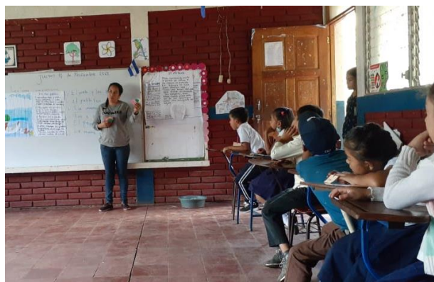
Figura 2. Economía de ficha Fuente: estrategias

El 29 de agosto del 2022: Se le presentó y entregó una estrategia a la docente para que ella la aplicara en el aula de clases llamada “ Economía de fichas ”, ésta tenía como objetivo que, al inicio de las clases, se les entregaría cinco fichas a cada alumno y por cada conducta inapropiada durante el transcurso de las clases se les restaría