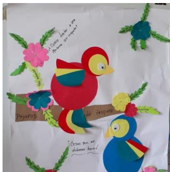
Actividad: "Pájaro del respeto"