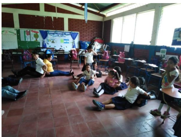
Actividad "espaldas pegadas"