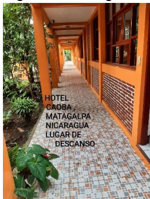
Figura 2: Fotografía Hotel Caoba S.A.