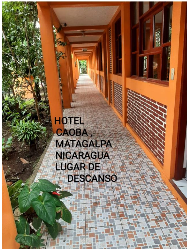
HOTEL CAOBA , MATAGALPA NICARAGUA LUGAR DE DESCANSO