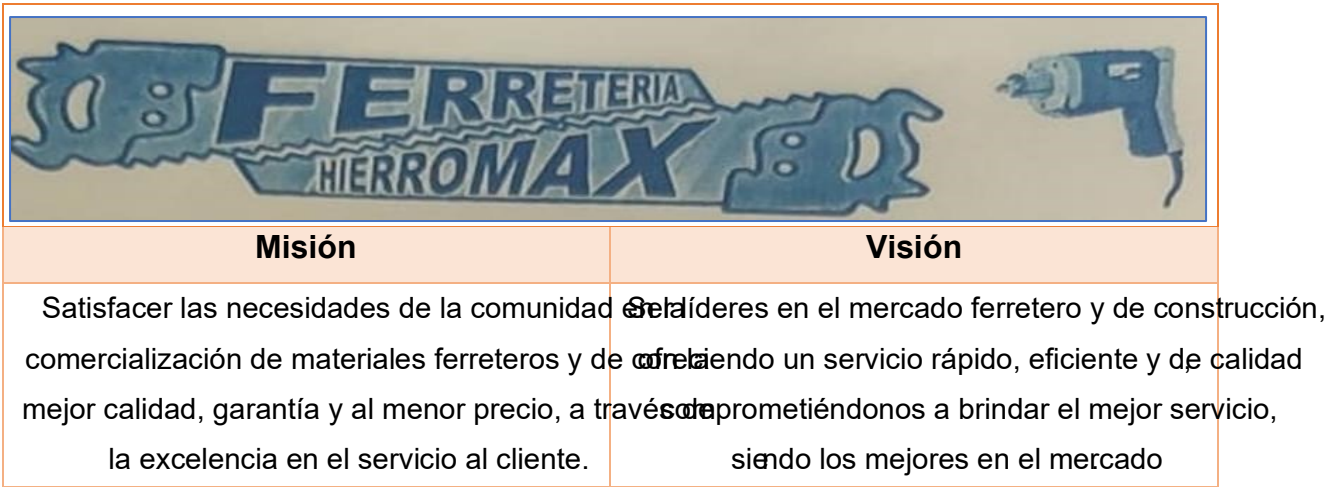
Figura 3: Propuesta de misión y visión

lo que justifica su existencia y para qué ha sido creada, por tal razón se presenta una propuesta de misión y visión para que la ferretería tenga a bien considerarla como propia: