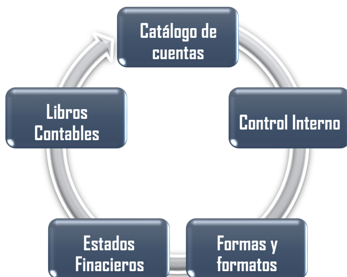
Figura 31: Elementos del sistema contable