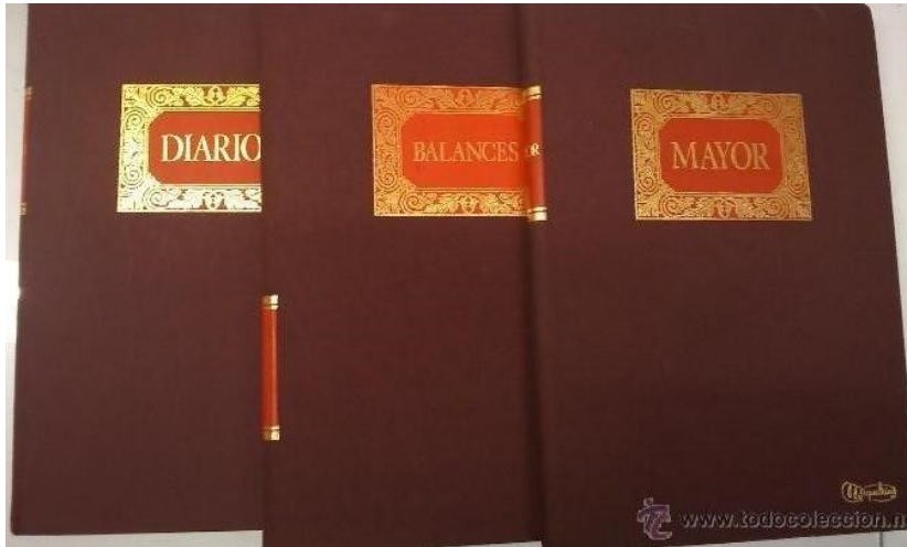
Figura 4: Libros contables

Balances e inventarios, debiendo conservarlos hasta que termine de todo punto la liquidación de sus negocios.