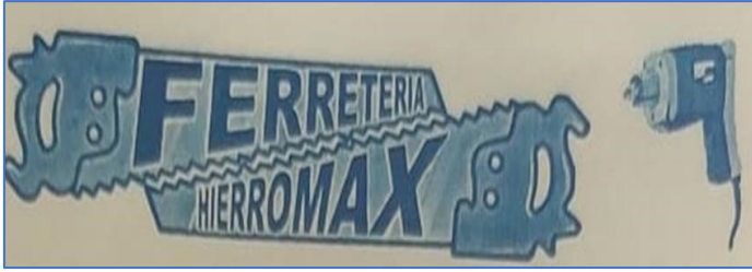
Figura 2: Logo de la empresa

Esta empresa está ubicada contigua calle central, salida al Comején.