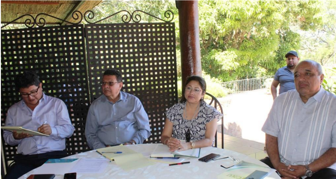
Ilustración 8 Taller de Planificación Estratégica con fines de mejora