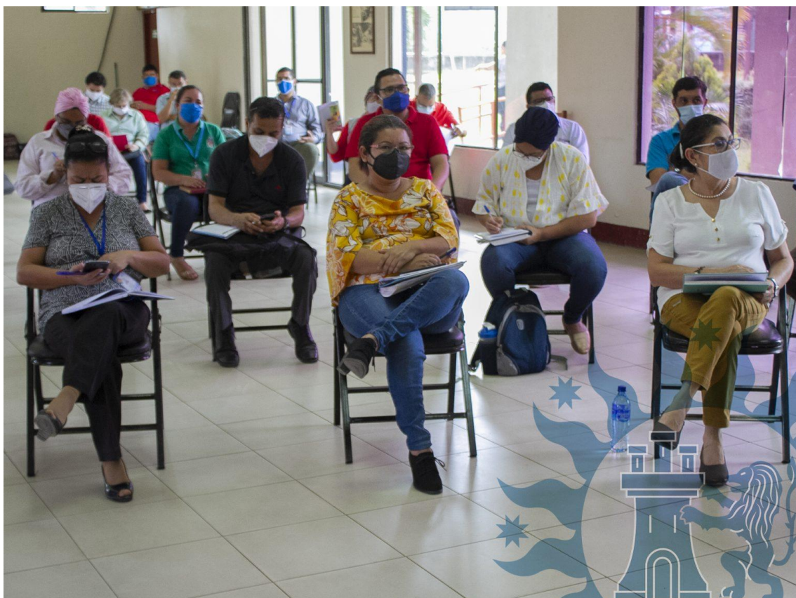
Ilustración 2 https://farem.unan.edu.ni/notas-informativas/estrategia-de-continuidad-educativa-con-calidad/

Docentes de esta casa de estudios superiores participan en capacitación sobre la Estrategia para la continuidad educativa con calidad en el contexto de la pandemia del COVID-19, facilitada por personal de la Dirección de Docencia de Grado de la UNAN-Managua.