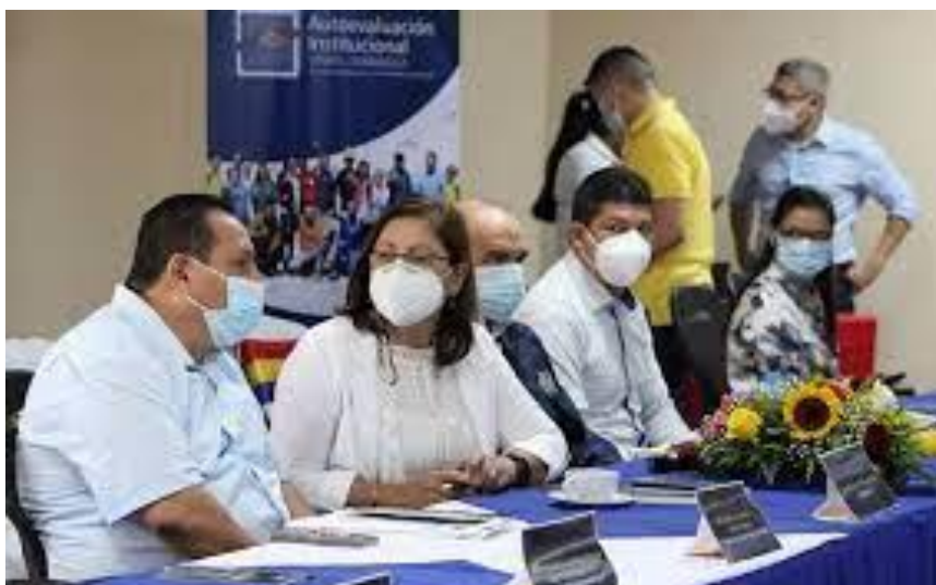
Ilustración 12 Hacia la Acreditación Institucional. www.unan.edu.ni