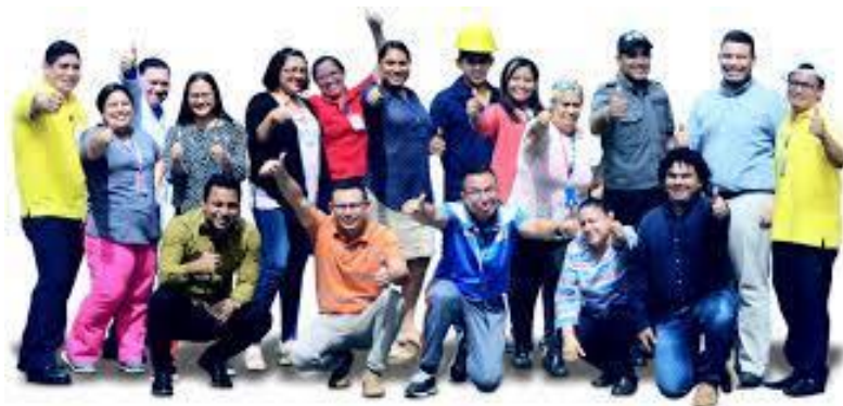
Ilustración 11 Proyecto de Autoevaluación Institucional. www.unan.edu.ni