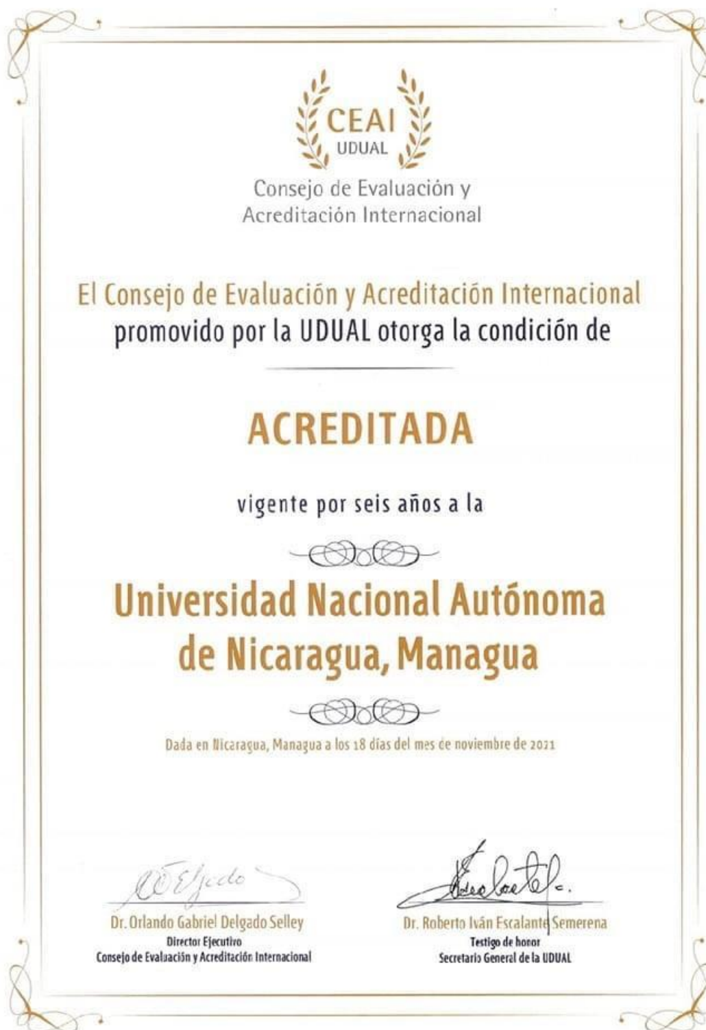
Ilustración 13 Acreditación Internacional. www.unan.edu.ni