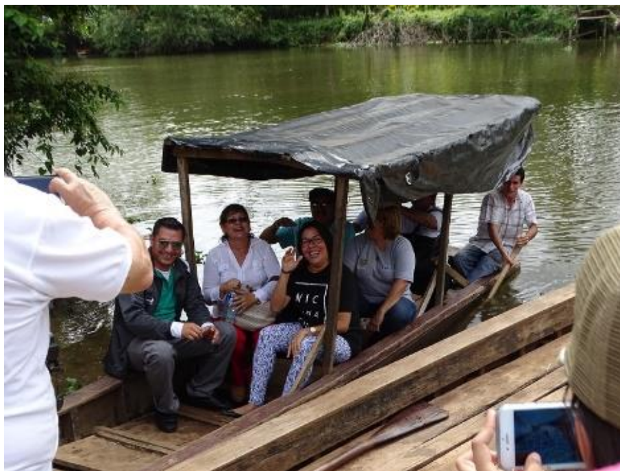
Ilustración 6 Autoridades Llegando al Castillo; Rio San Juan, Programa UNICAM.