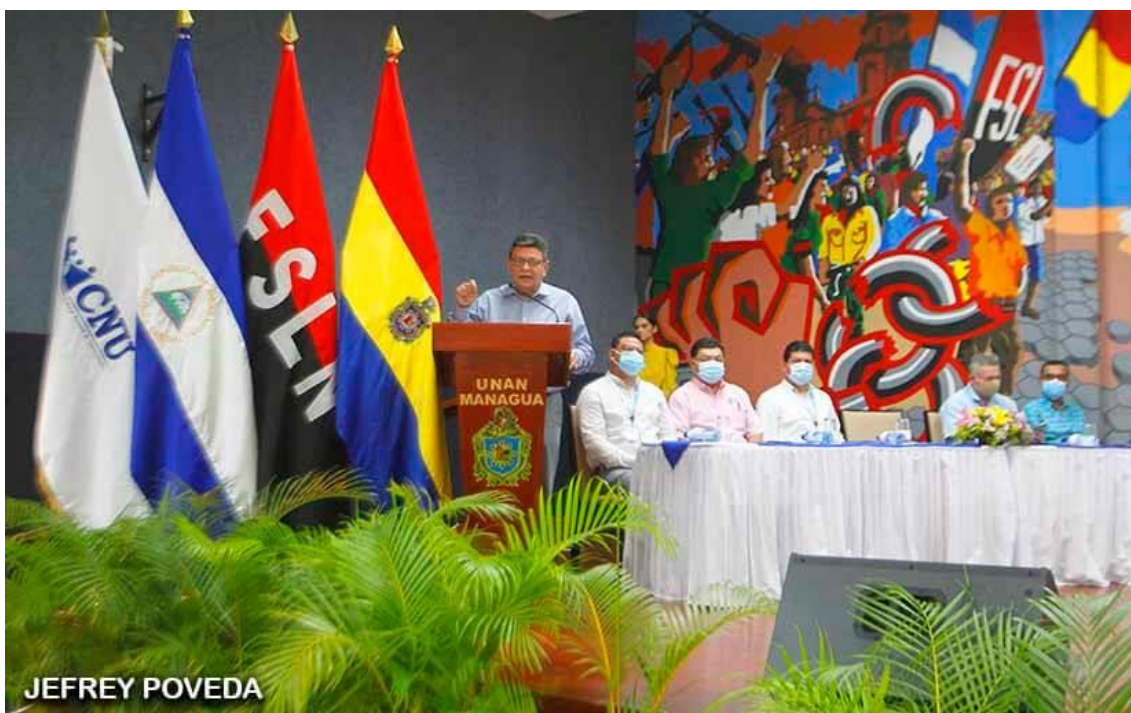
Ilustración 10 Congreso aborda impacto de las tecnologías en medio de la pandemia. https://www.el19digital.com/articulos/ver/titulo:122100-congreso-aborda-impacto-de-las-tecnologias-en-medio-de-la-pandemia-