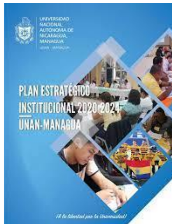
Ilustración 9 Portada de Plan Estratégico Institucional UNAN Managua 2020-2024