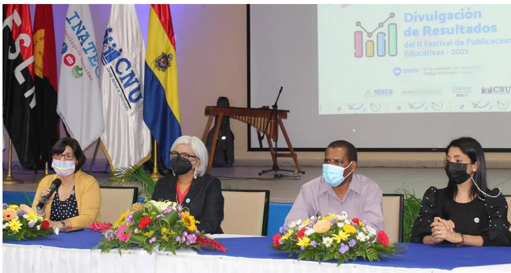
Ilustración 3 Articulación Subsistemas Educativos