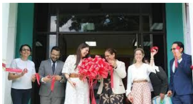
Ilustración 14 Parte de las actividades realizadas en áreas de Extensión e Innovación