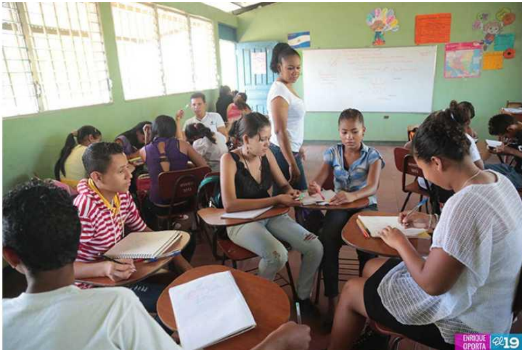
Ilustración 5 Acompañamiento Pedagógico UNICAM