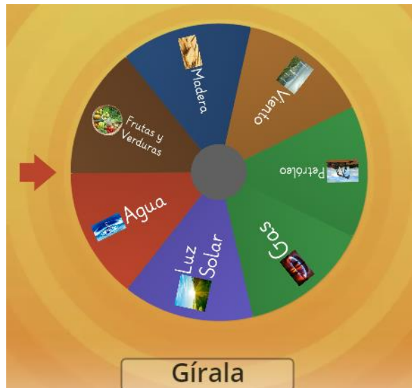
Ilustración 1 Ruleta obtenida de https://wordwall.net/es/resource/20985998/recursos-naturales