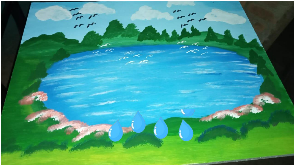
Ilustración 7 Ejemplo de la laguna de aprendizaje