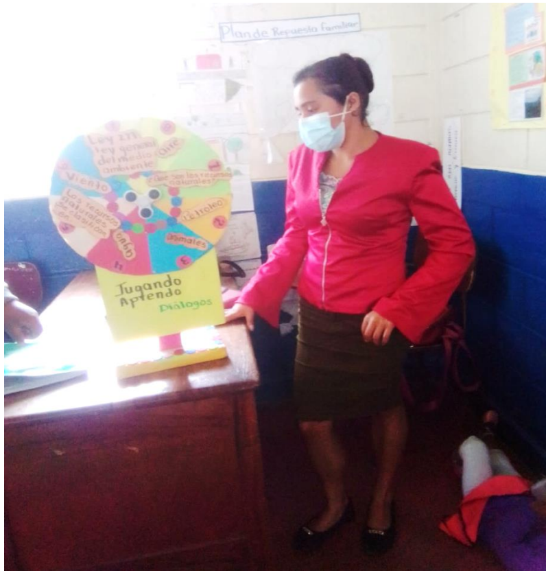
Ilustración 14 Explicación de Ejercicio