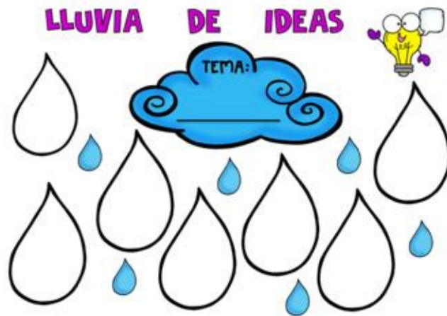
Ilustración 3 Esquema de ejemplo para lluvia de ideas