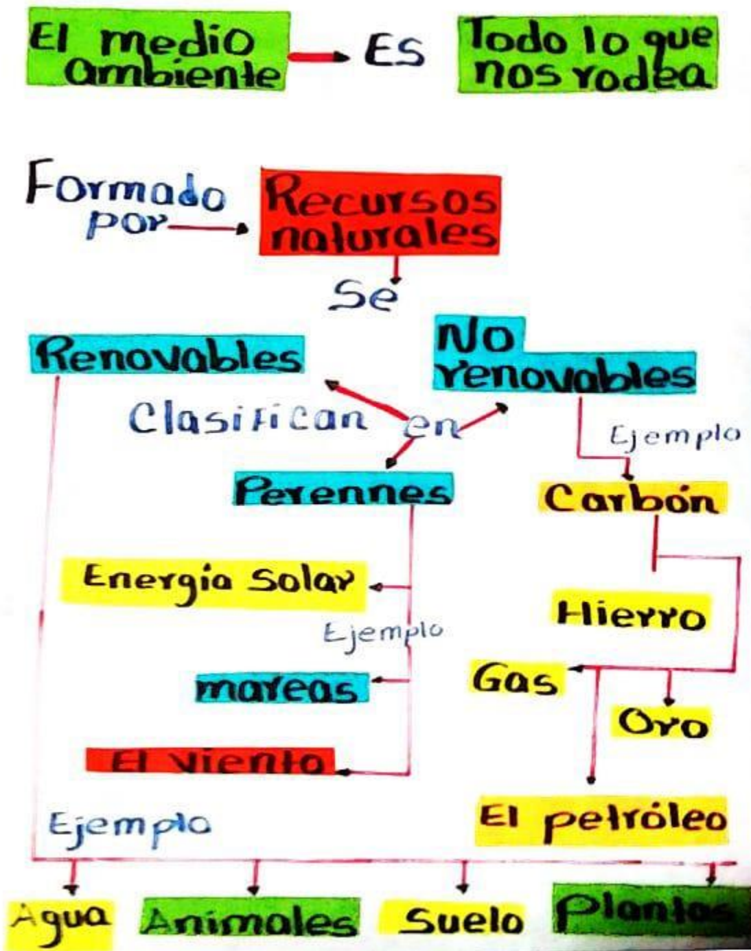
Ilustración 10 Esquema gráfico