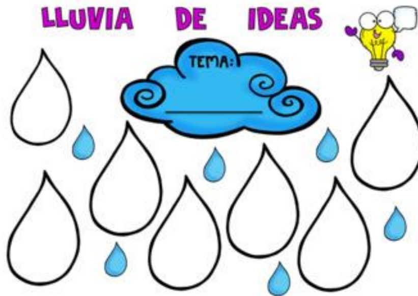
Ilustración 8 Esquema de ejemplo para lluvia de ideas

Conocimientos previos que debe poseer el estudiante con respecto al contenido.