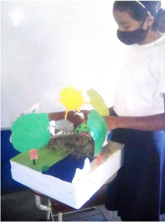
Ilustración 176 Manipulación de Maquetas