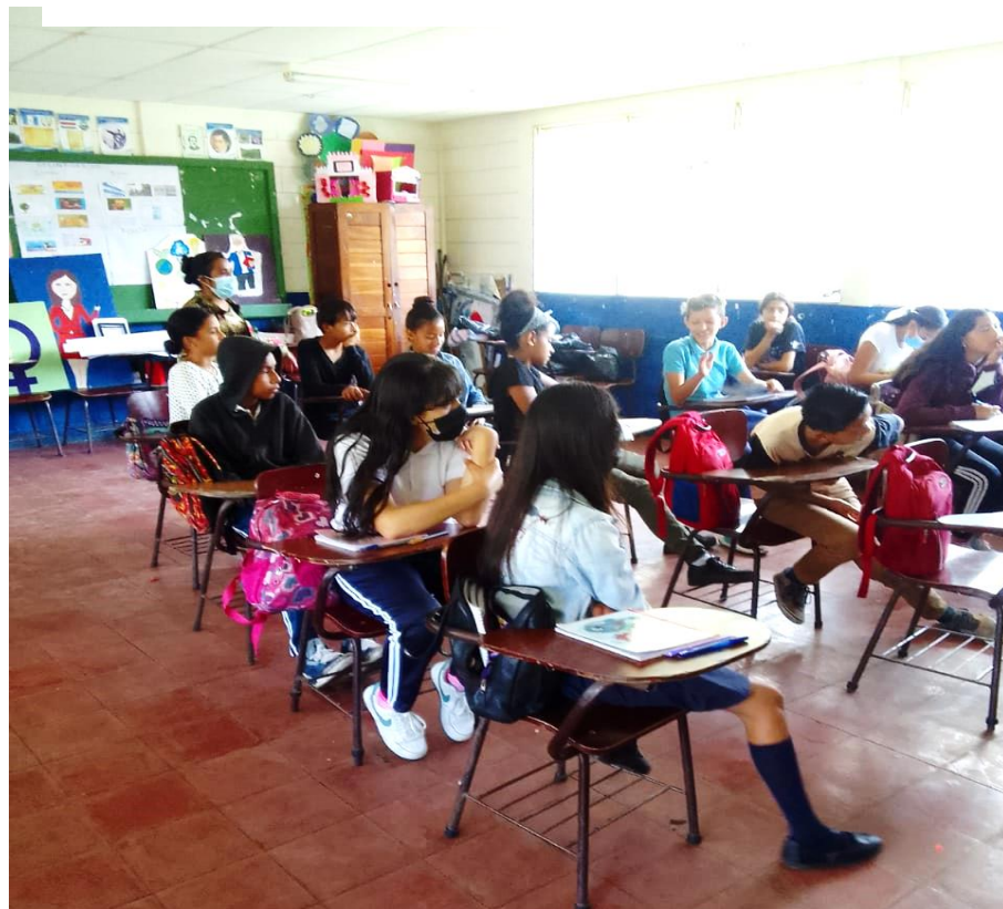
Ilustración 15 Participación de los Estudiantes