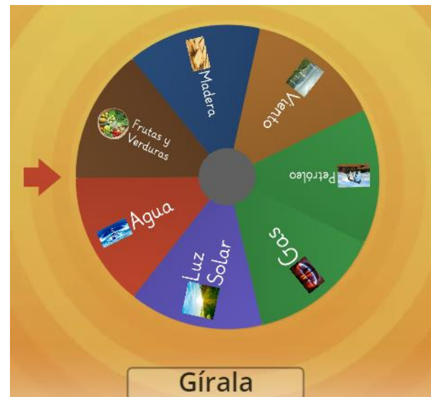
Ilustración 4 Ruleta