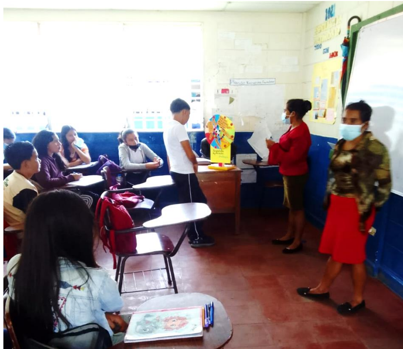
Ilustración 13 Jugando con la Ruleta