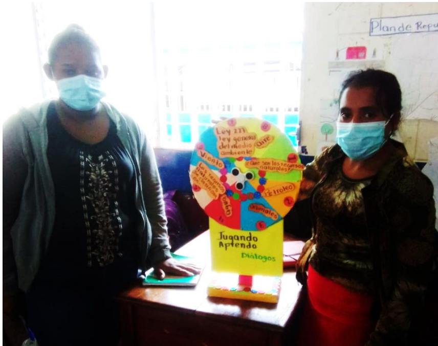
Ilustración 12 Presentación de la Ruleta