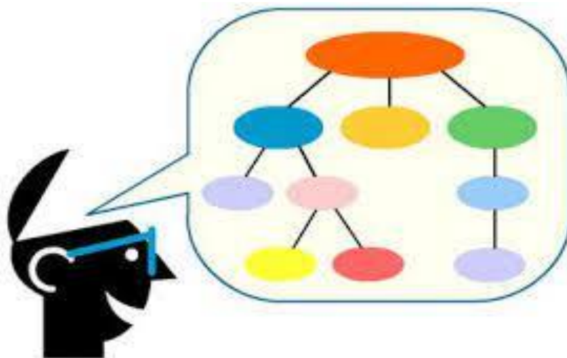
Ilustración 2 Esquema de un organizador gráfico