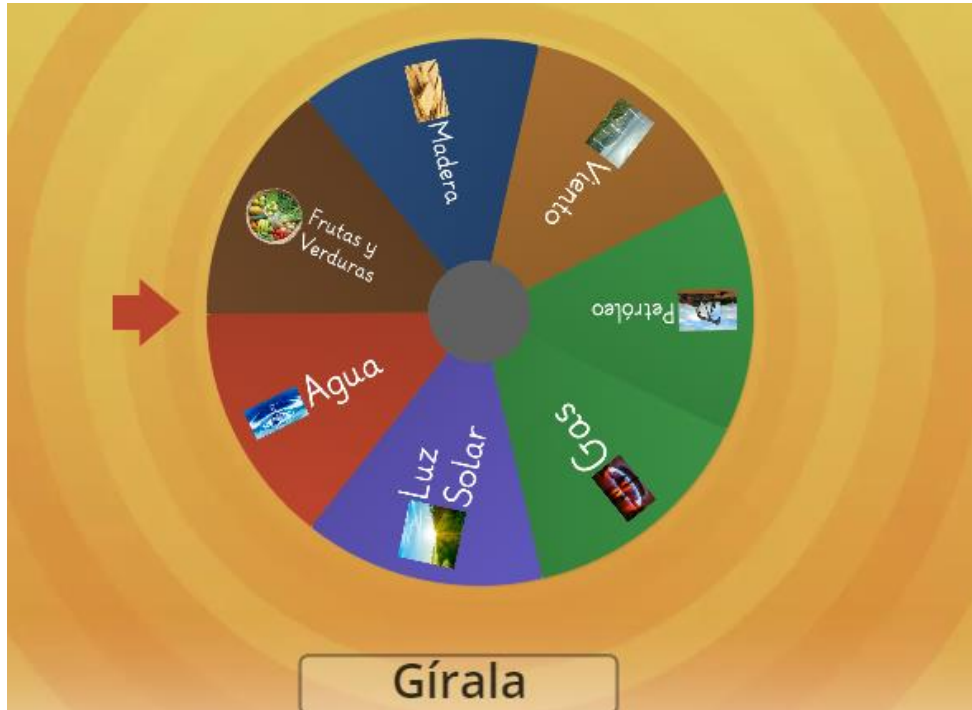
Ilustración 9 Ruleta obtenida de https://wordwall.net/es/resource/20985998/recursos-naturales

Realizar anotaciones en su cuaderno de los comentarios durante la realización del juego.