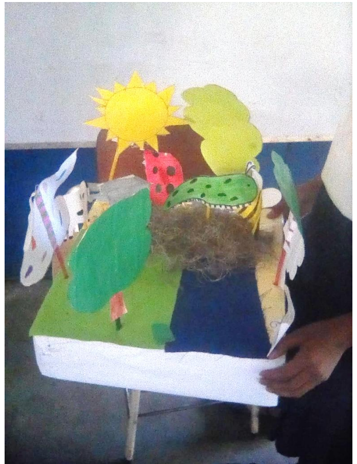
Ilustración 167 Manipulación de Maquetas