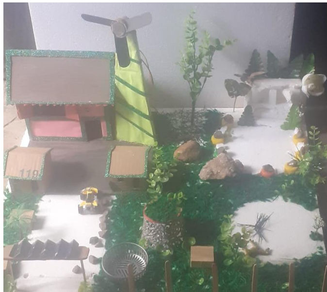
Ilustración 6 Maqueta de un grupo de trabajo