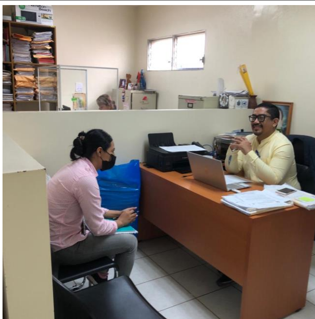
Figura No. 6. Aplicación instrumento. Delegado