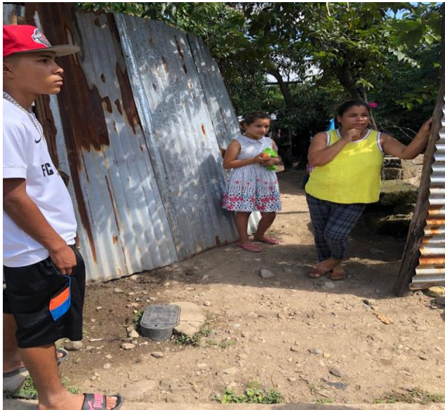
Figura No. 1. Visita domiciliar adolescente remitido por Defensoría Pública.