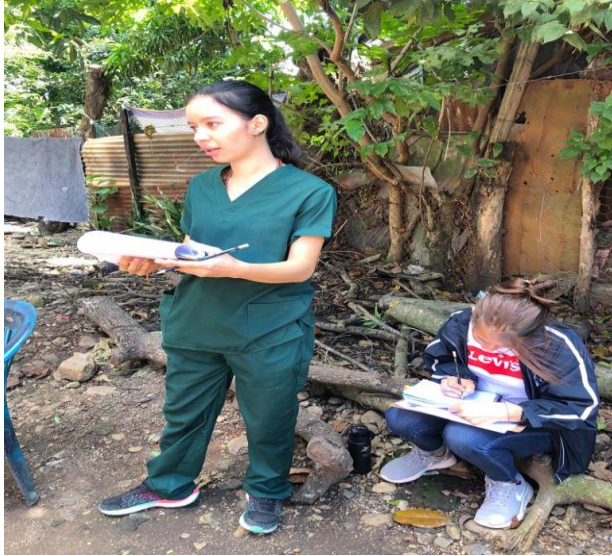
Figura No. 7. Visita domiciliar familia remitida.