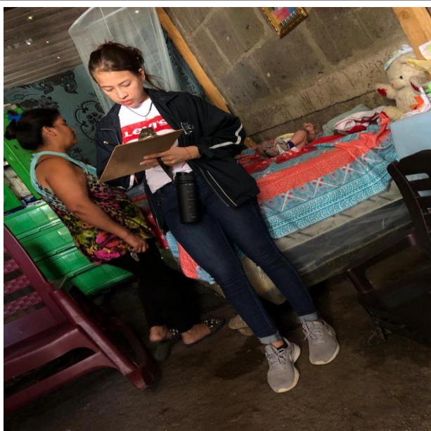
Figura No. 3. Aplicación instrumentos. Cuidadora.