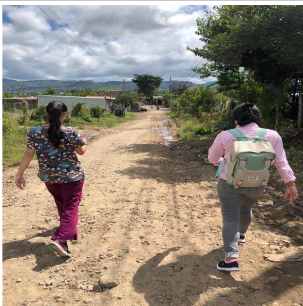
Figura No. 5. Trabajo de campo.