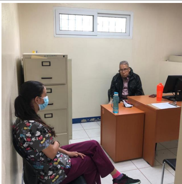
Figura No. 4 Contacto con Defensor Público.