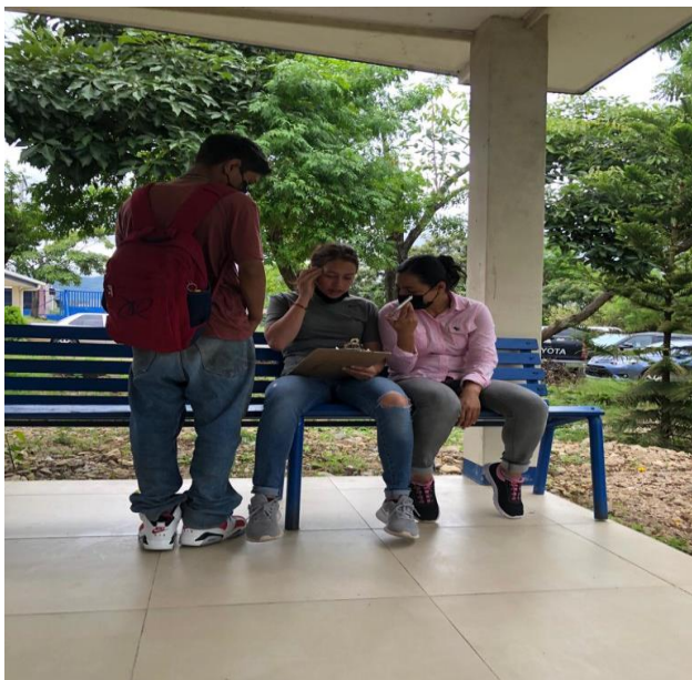
Figura No. 2 Aplicación de instrumentos.