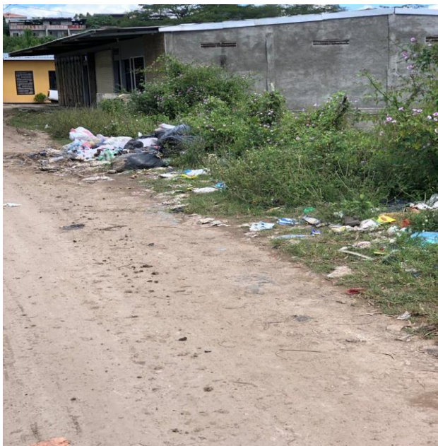
Figura No. 8. Condiciones de los sectores visitados.