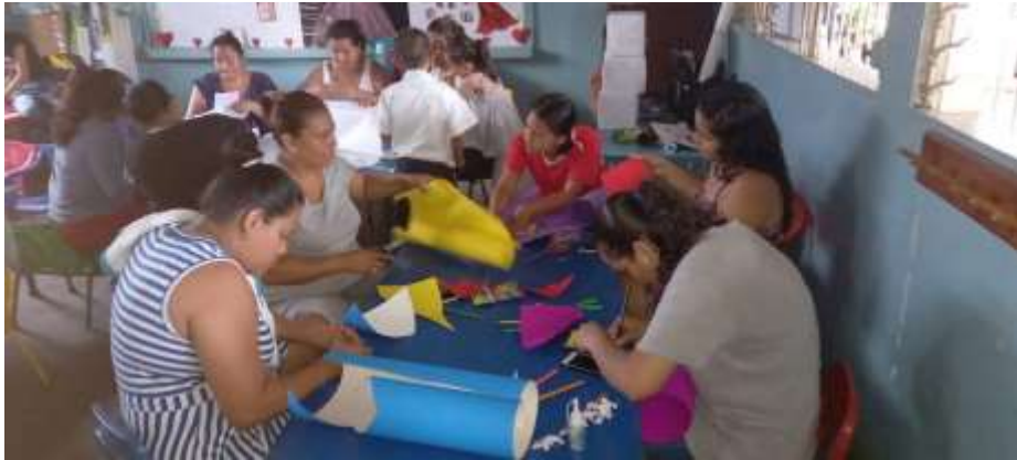
Madres participando del taller