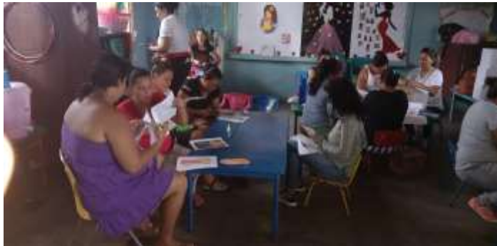
Madres de familia participando en la capacitación