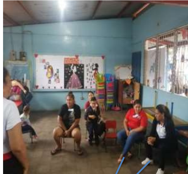
Docentes participando en la capacitación

El taller lo impartimos el día 22 de junio a las 3:00 pm. Donde de igual manera se realizó la invitación digital y se le compartió a las docentes para que las compartieran con los padres vía whatsapp, donde se realizó con éxito, porque obtuvimos mayor cantidad (18) de padres de familia. Se desarrollo de la siguiente manera: