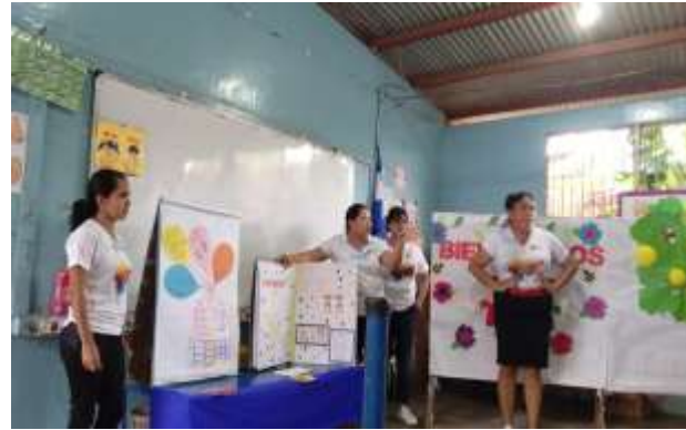
Nosotras impartiendo la capacitación