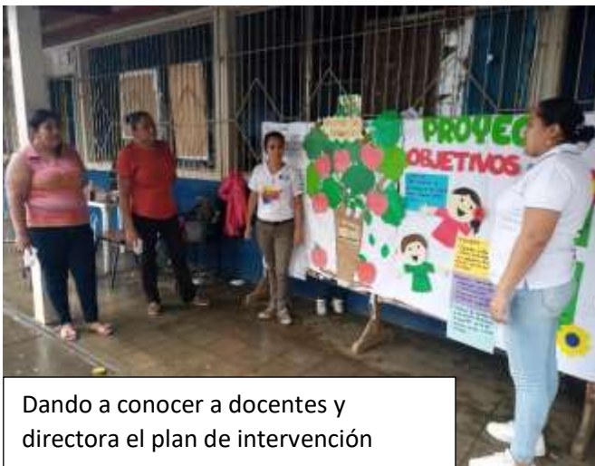
Dando a conocer a docentes y directora el plan de intervención

Después de varios días de observación realizadas en el colegio público Juan Bautista Arríen, encontramos que en el aula donde imparten las clases de preescolar carecen de espacios de aprendizajes, esto hizo que nuestro interés se centrara en este problema; pues consideramos que un aula con buenos espacios de aprendizaje hará que los niños obtengan un mayor desarrollo en su proceso de enseñanza – aprendizaje. Con la finalidad de resolver la necesidad encontrada,