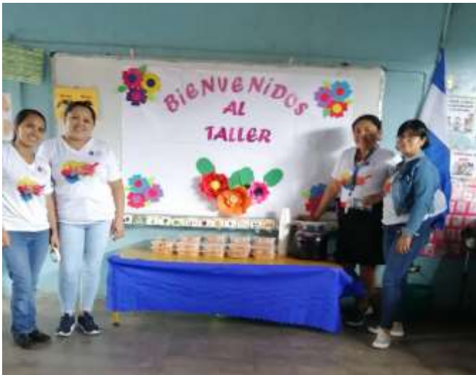
Día del Taller