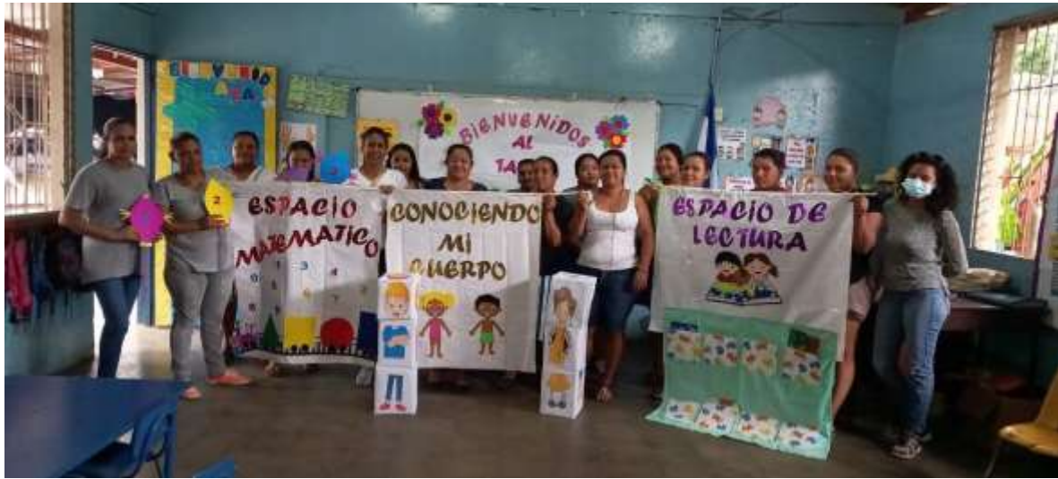
Terminado todos los espacios de aprendizaje.