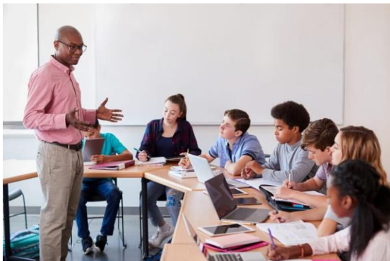
Imagen Nª 2

Estrategia aprendizaje-convivencia, donde el docente interactúa con sus estudiantes mediante una convivencia armónica y empática a través de la motivación de la materia.