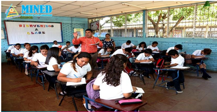
Imagen Nª 1

Estrategia aprendizaje-convivencia, donde el docente interactúa con sus estudiantes mediante una convivencia armónica y empática a través de la motivación de la materia.