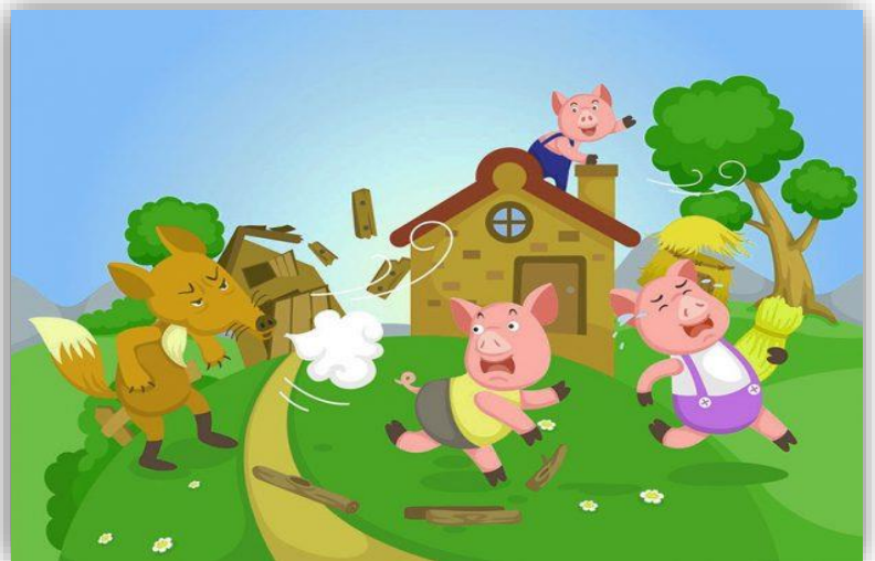
Ilustración 1 Cuentos con acciones