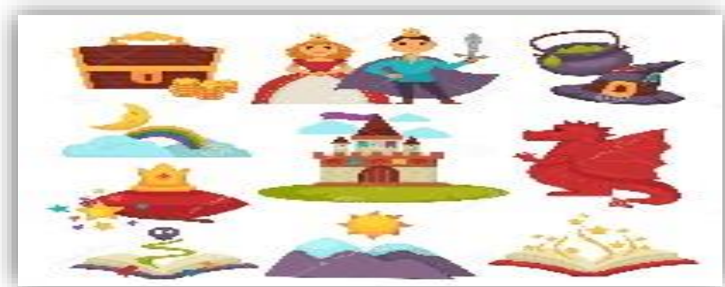
Ilustración 2 Personificación de Cuentos