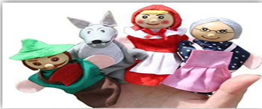
Ilustración 6 Cuento con Títeres

A seleccionar el material a utilizar, debemos tomar en cuenta la edad y nivel de desarrollo mental de los estudiantes. Si para narrar el cuento utilizamos libros, los niños (as) irán pasando páginas al mismo tiempo que el narrador, sin retroceder. Si se usa franelógrafos las figuras serán manejadas de acuerdo a lo que se van narrando.