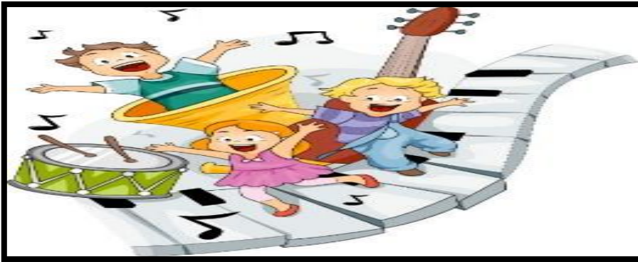
Ilustración 4 Cuentos con música sonidos y canciones

La técnica que se aplica para estos cuentos no difiere mucho de la utilizada en los cuentos con sonidos onomatopéyicos solo que incorpora la memorización musical.