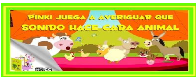
Ilustración 3 Sonidos onomatopéyicos.

En estos cuentos se repiten los sonidos onomatopéyicos emitidos rítmicamente y con variación del tono. Estos cuentos pueden presentarse a través de los siguientes pasos metodológicos: