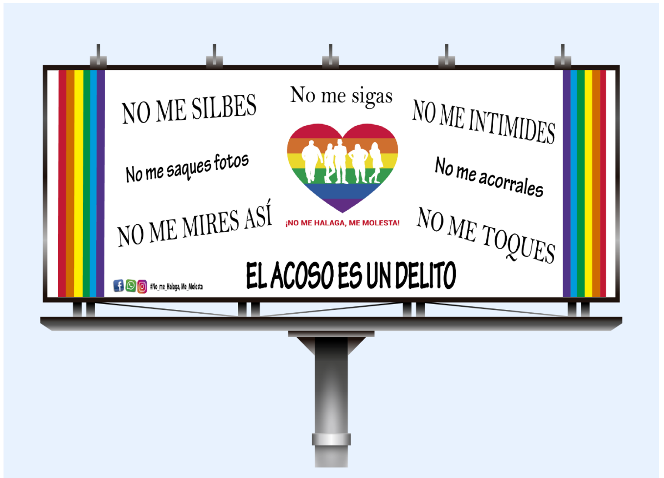
Fig. N ro 7 Valla Publicitaria