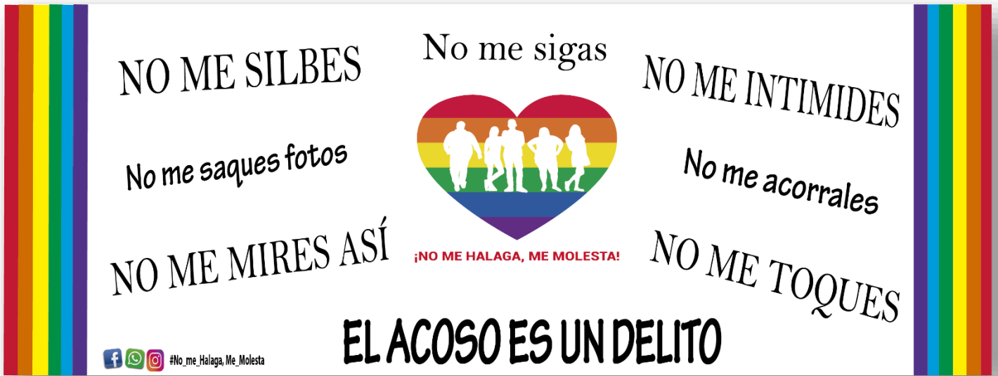
Fig. N ro 6 Valla Publicitaria