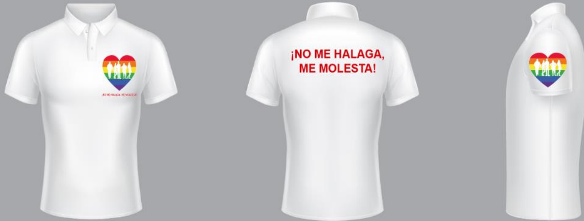
Fig. N ro 2 Camisas Referente a la Campaña