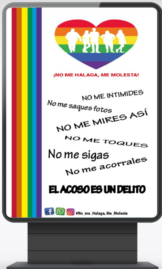
Fig. N ro 3 Muppi