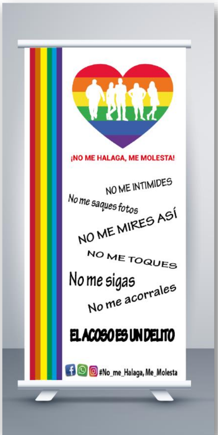
Fig. N ro 5 Banner