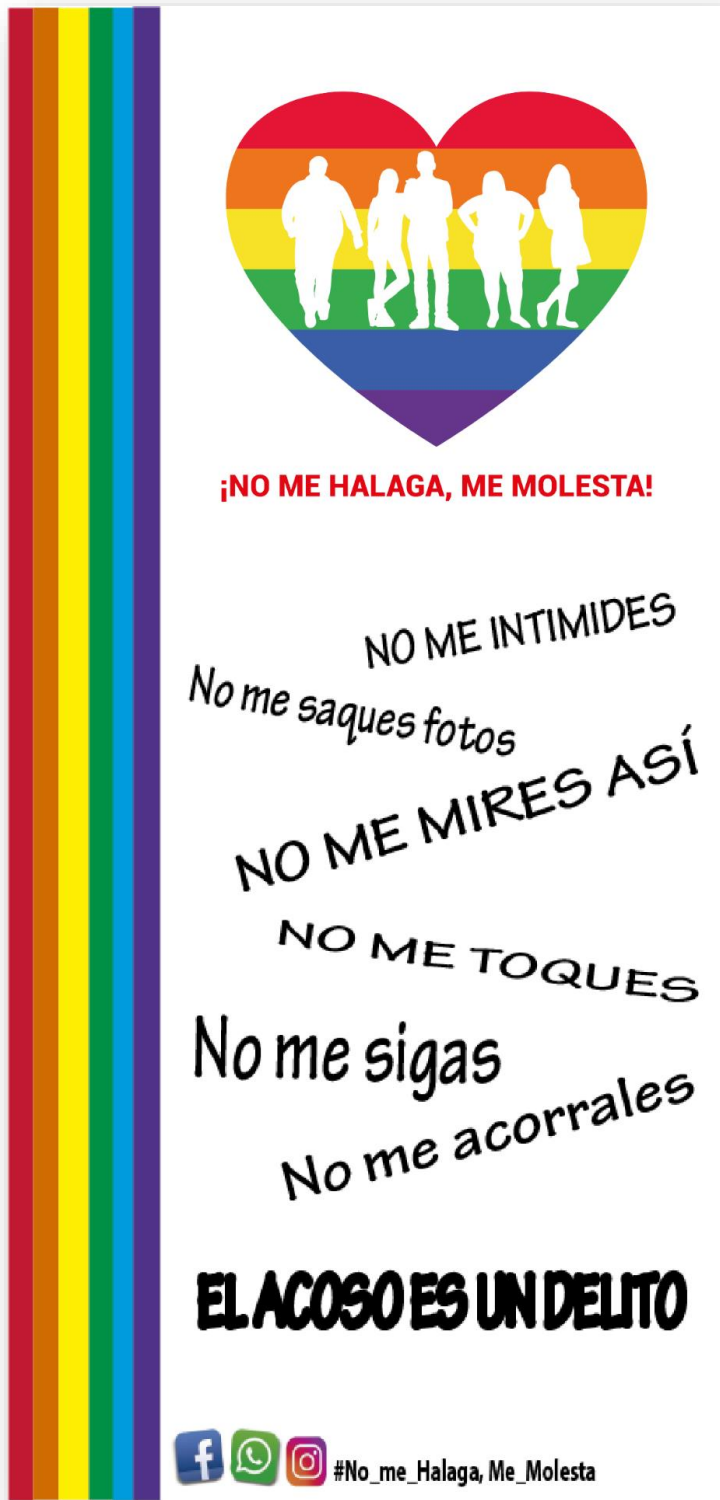
Fig. N ro 4 Banner