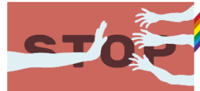
Fig. N ro 8 Brochure