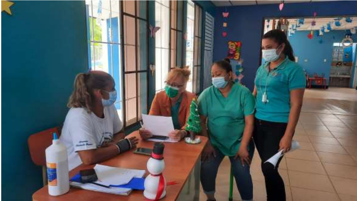
Entrevista a Docente