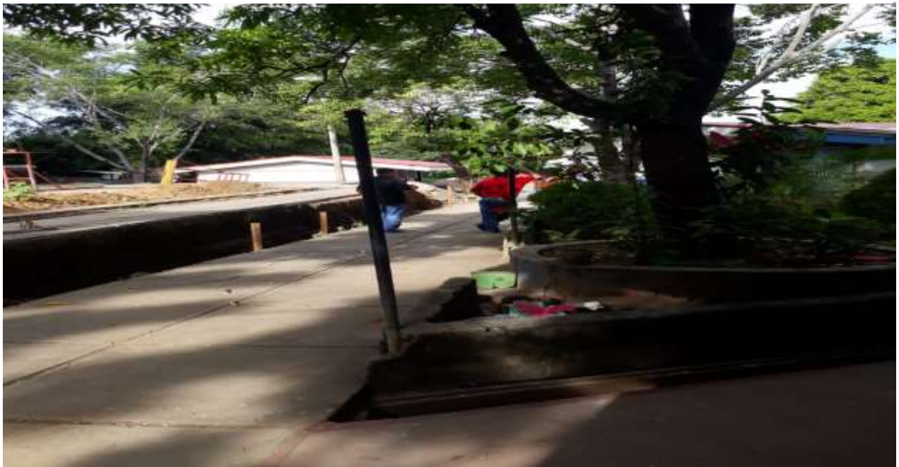
Remodelación del Colegio Público República de Cuba