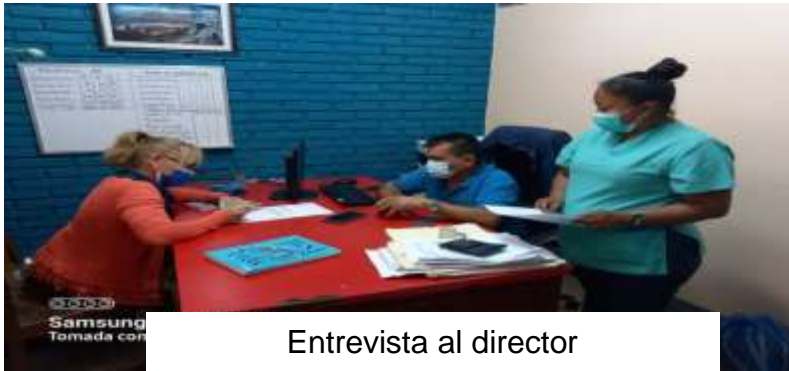
Entrevista al director

(Blanco, s.f.) Expresa que los directores son actores claves para la vida de toda educación educativa, ya que ellos son quienes pueden marcar el rumbo y la visión de toda la escuela. Ellos promueven el desarrollo de las capacidades de los docentes, el trabajo colaborativo y generan las condiciones de un buen clima institucional afirma según Agustina Blanco. (2018 y 2019).