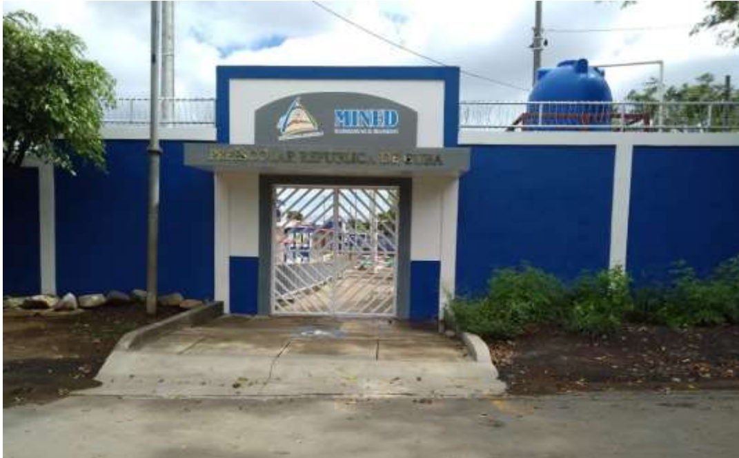
Entrada independiente a preescolar del Colegio Público República de Cuba