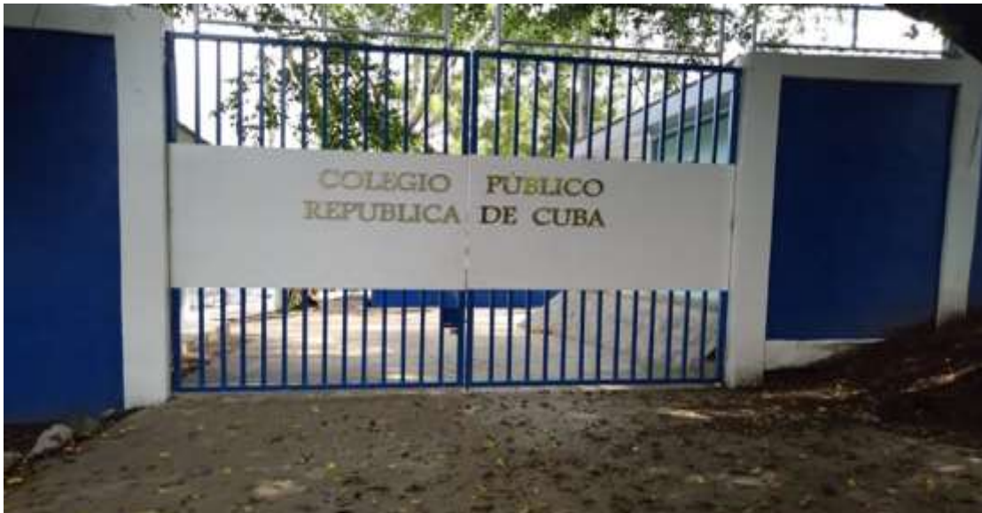
Segunda entrada del colegio público República de Cuba