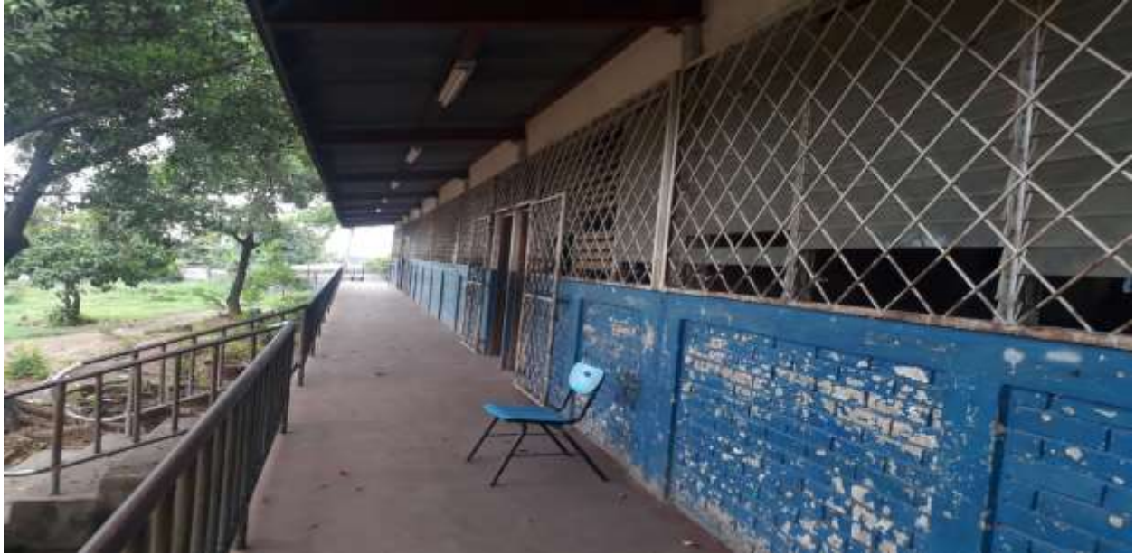
Edificio antes de ser remodelado el Colegio Público República de Cuba