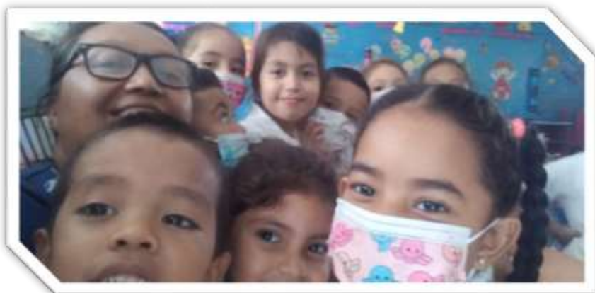
NIÑOS Y NIÑAS DEL III NIVEL QUE SE LES APLICÓ LA ENCUESTA 25/10/2021