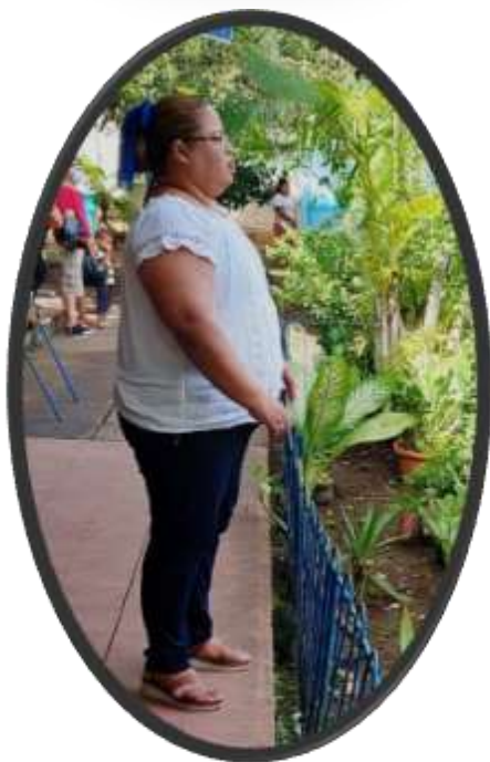
DIRECTORA DEL COLEGIO