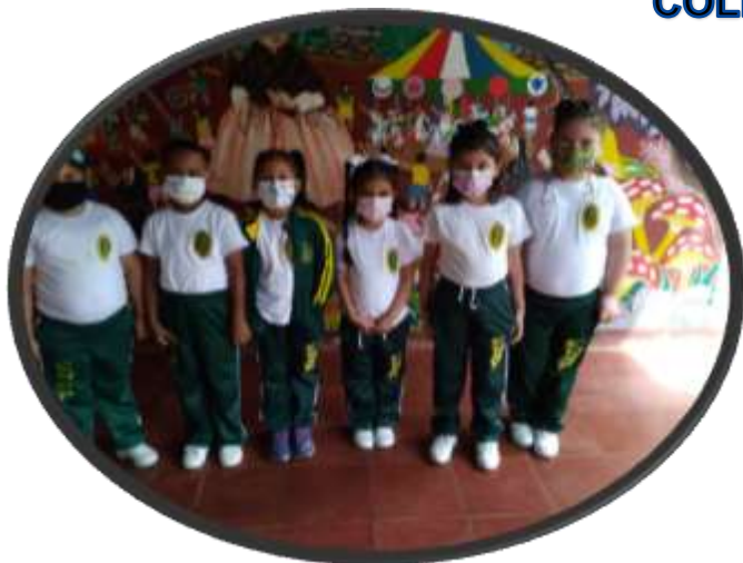
Niños y Niñas del III nivel que realizaron la encuesta 26/10/2021 del Grupo B