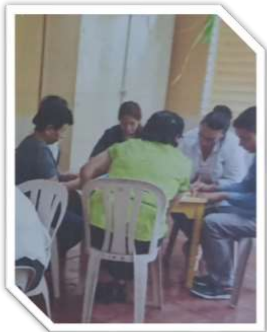
ENTREVISTA A PADRES Y MADRES DE FAMILIA DEL III NIVEL 09/11/2021