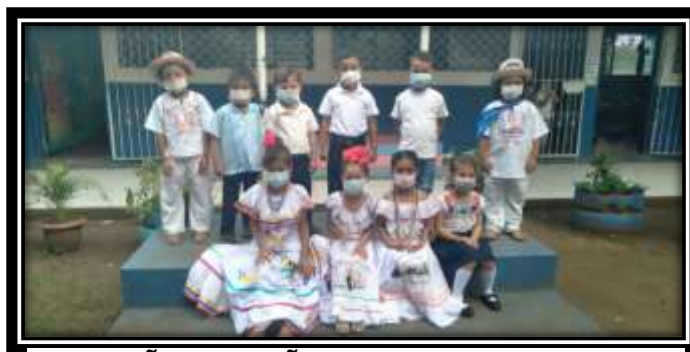
NIÑOS Y NIÑAS DEL III NIVEL EN PRESENTACION CULTURAL 2021