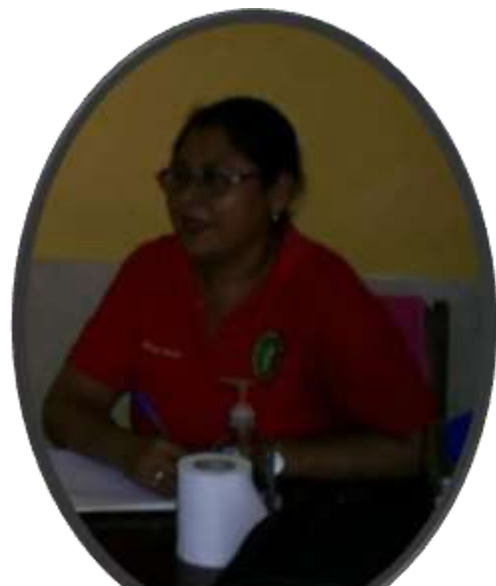
ENTREVISTA A LA DOCENTE DEL III NIVEL 13/10/2021