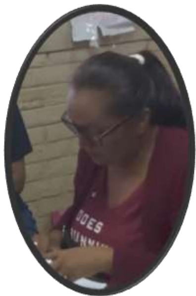
ENTREVISTA A LA DOCENTE DEL III NIVEL 04/10/2021