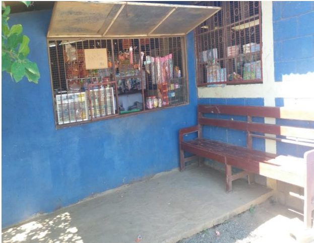
Quiosco del centro