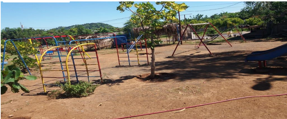
Área de recreación