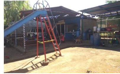
Comedor y bodega

La fuerza laboral con que cuenta el centro escolar es de 9 docentes, 1 conserje, 1 secretario, 1 director, 1 cocinera y 1 persona que atiende la librería.