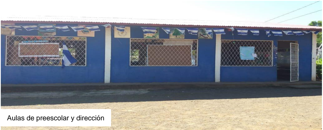
Aulas de preescolar y dirección