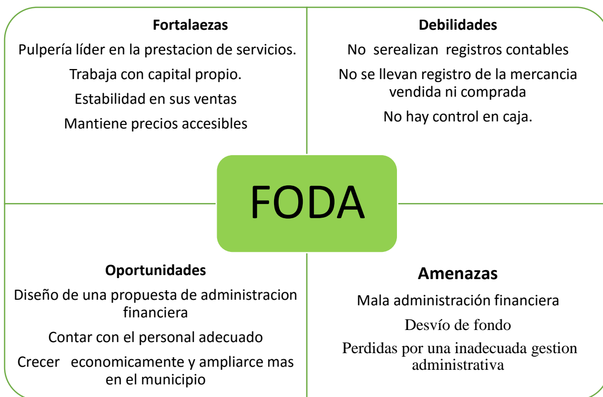
Ilustración 2: Análisis de FODA de la Propuesta de Administración Financiera.