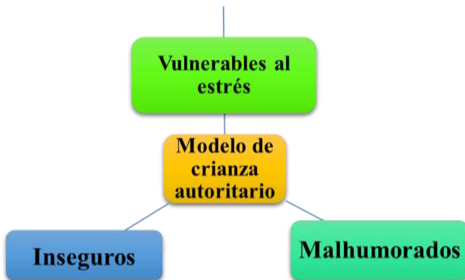
Figura 2. En el SmartArt se presenta como los modelos de crianza usados por las familias inciden en el comportamiento de los estudiantes del colegio Metodista Libre.

Es importante señalar, que la mayor parte de las veces si su crianza en el hogar del menor es muy autoritaria el niño crecerá con esa misma ideología de crianza en el cual este retomará para cuando procee a sus hijos.