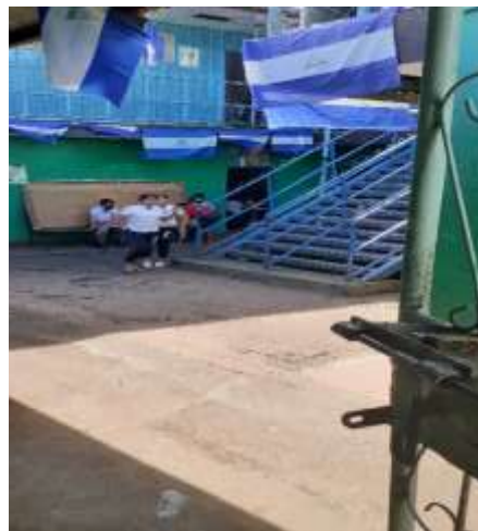
Fuente: (Fotografía de Keyla Maltez). (Colegio Metodista Libre.2020)