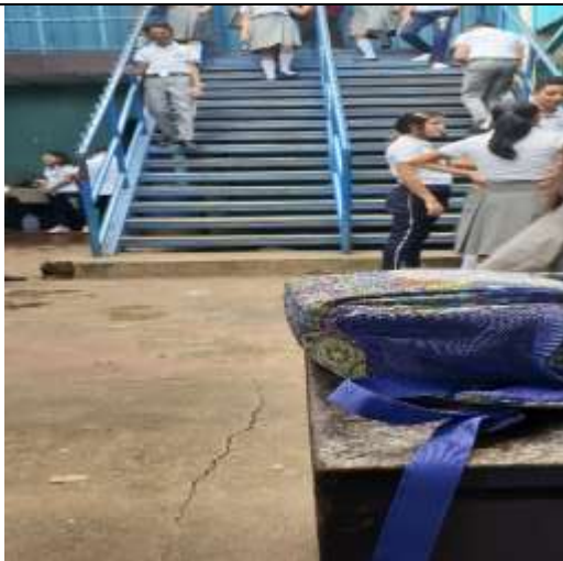
Fuente: (Fotografía de Valeska Mendoza). (Colegio Metodista Libre.2020)