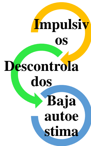
Figura 3. En el SmartArt muestra de que manera afecta este modelo permisivo en el comportamiento del adolescente.

Sin embargo, la facilidad del acceso de la información no es un factor que determine que la familia va a tener más conocimiento en el momento de criar a los niños, una de las frases más comunes es “no hay instrucciones para criar bien a un niño” tal es el caso que intentan darles o mucho amor, confianza y libertad, o bien todo lo contrario, es un hecho que la familia y el individuo tiene distintas maneras de percibir su entorno.