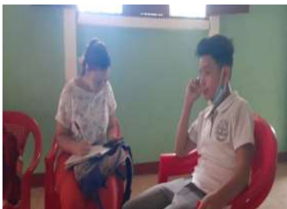
Fuente: (Fotografía de Valeska Mendoza).(Colegio Metodista Libre.2020)