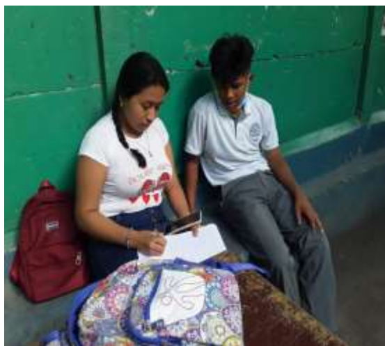
Fuente: (Fotografía de Luisa Martínez). (Colegio Metodista Libre.2020)