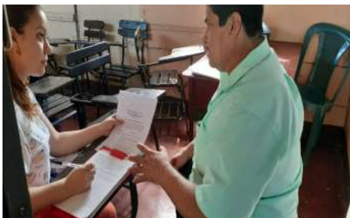
Fuente: (Fotografía de Valeska Mendoza). (Colegio Metodista Libre.2020)