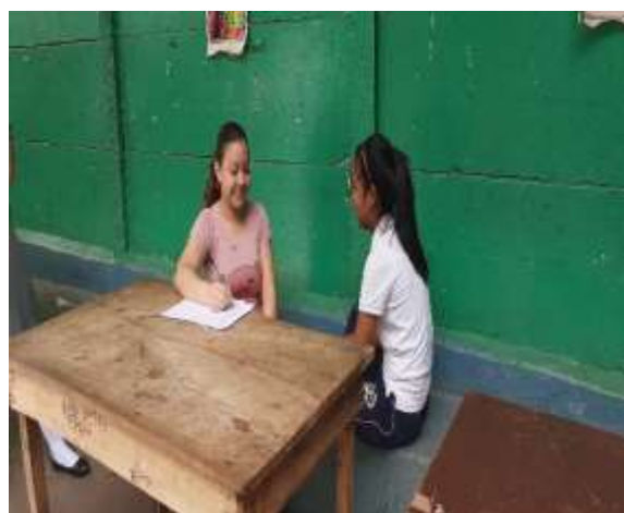
Fuente: (fotografía de Valeska Mendoza). (Colegio Metodista Libre,2020)