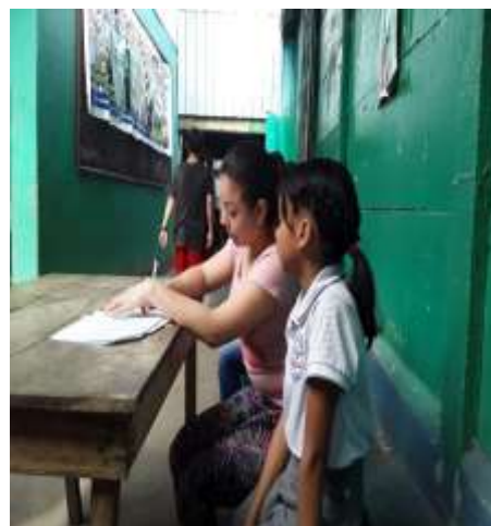
Fuente: (Fotografía de Valeska Mendoza). (Colegio Metodista Libre.2020)

“para comprender el amor de tus padres, debes de criar a tus hijos tú mismo”