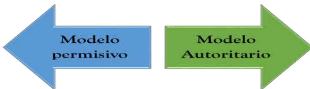
Figura 1. En el SmartArt se representa los dos modelos crianza empleados por padres de familias de la educación de sus hijos

Estas tienen un impacto en el joven y si carece de afecto por parte de la familia altera el proceso de comunicación con los miembros de ella, ya que pierde la función para lo que está diseñada la familia, su factor protector. Por otro lado, existen diferentes tipos de familia, como la nuclear que se encarga de sustentar económicamente y afectivamente, llenando las necesidades del individuo para su debida formación, en las entrevistas se obtuvo información que respalda la importancia del afecto en la familia.