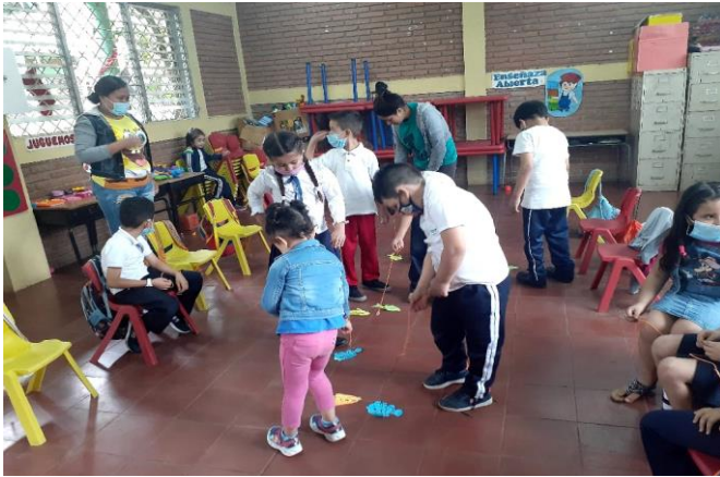
Niñas y niños participando por turnos de la estrategia La Pesca