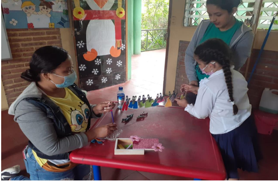
Reconociendo colores y practicando la precisión en estrategia El Tendedero