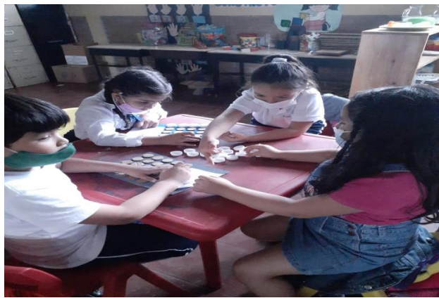
Apoyándose en la reproducción de figuras