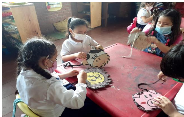
Realizando ensarte a figuras perforadas