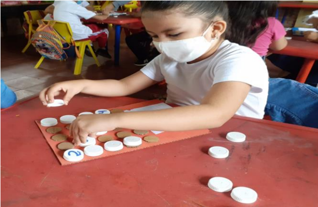
Haciendo uso de la Tabla de 25 puntos