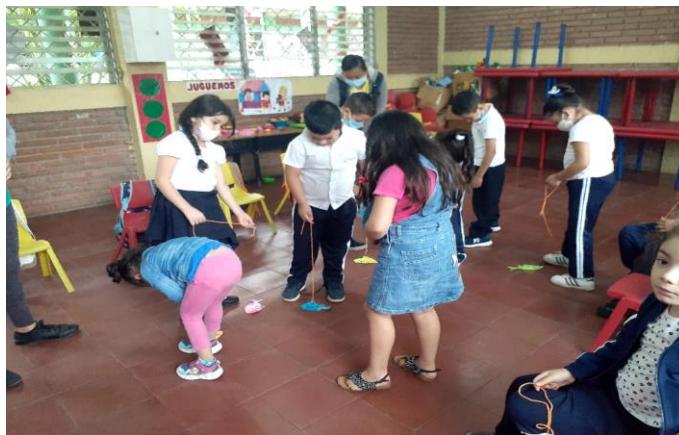
Practicando La pesca