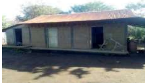
estructura, de casa a base de cemento y madera, 28-12-20

En esta comuna las casas son hechas a base de cemento con madera en su mayoría y un pequeño porcentaje de casas son hechas con cercos de bambú y techo de zinc con madera, en la comuna la estructura de las casas también depende de los estatus económicos de las familias, por ende, la mayoría son hechas a base de cemento y madera,