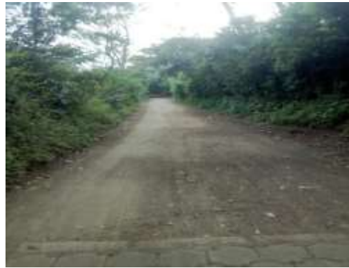
Fuente: tomada por autor de monografía, calles sin mantenimiento, 01-12-20

“La comunidad de los jirones durante su fundación no ha recibido mejoras de gran magnitud en lo que respecta a infraestructura tanto en casas como en calles, solamente ha evolucionado en ser más poblada y la obtención de los servicios básicos como salud, educación y otros servicios elementales que son vitales para subsistir”(Vásquez, 25-11-20) este informante relata que en el aspecto de calles aun no habido cambios significantes para la población que la transita, resalta que la alcaldía solo le da mantenimiento para que no se deteriore. Y en medida de cierto tiempo esto no les impida a los agricultores sacar sus cosechas de las fincas. Otro elemento importante que ha