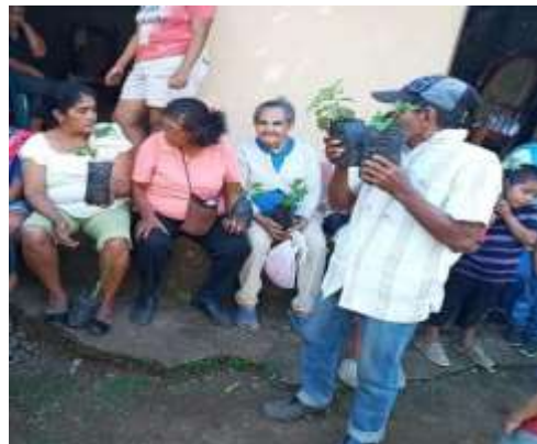
Fuente: Alcaldía Municipal, entrega de árboles frutales adultos mayores y población en general, 28-01-21.

Los adultos mayores cuentan con las condiciones necesarias en cuanto a servicios básicos que debe poseer un lugar que es habitado, sin embargo, los adultos mayores se sienten en confort debido a que están en constante contacto con la naturaleza en sus parcelas y al mismo tiempo con sus familias, una vez que ya que terminan su jornada laboral y se dirigen a sus hogares en la misma comunidad y a veces sus viviendas están dentro de la misma parcela