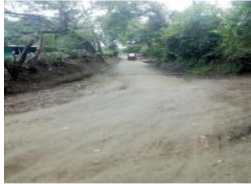
Fuente: tomada por autor de monografía, entrada a la comunidad los Jirones, Diría, 01-12-20

En el municipio de Diría se encuentra ubicada la comarca los Jirones, centro de estudio de este trabajo monográfico donde su objetivo es resaltar la integración laboral y social que realiza el adulto mayor en esta comunidad, seguidamente esta se localiza a unos 5 kilómetros del centro urbano del municipio de Diría, donde las principales actividades económicas de la comarca son las cosechas de los diferentes granos