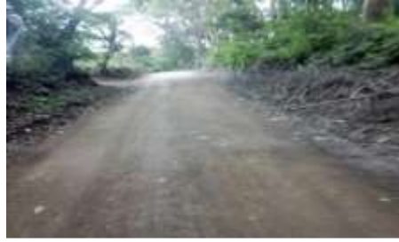
Fuente: tomada por autor de monografía, calles de tierra y pequeños trochos de adoquinado, 01-12-20

En la comunidad los jirones todas sus calles son de tierra, solo en pequeñas partes hay trochas de adoquinados en donde se consideran puntos críticos en la comarca, “la comunidad no ha recibido cambios en lo que se refiere a infraestructura de calles” (Vásquez, 25-11-20).