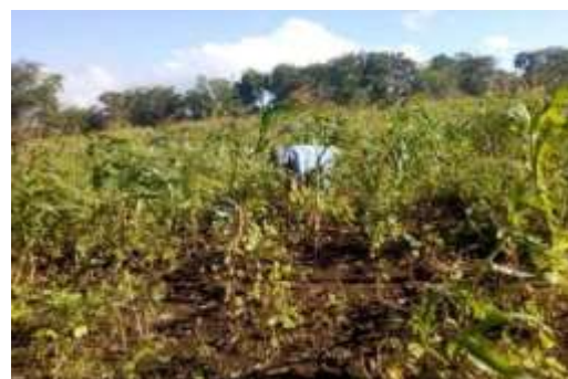
realización de limpieza a los cultivos, 28-12-20

La comunidad de los Jirones es una comuna que mantiene sus actividades económicas desde sus inicios, acá predomina la agricultura y la ganadería ya que estos son dos rubros que se han mantenido durante mucho tiempo, en