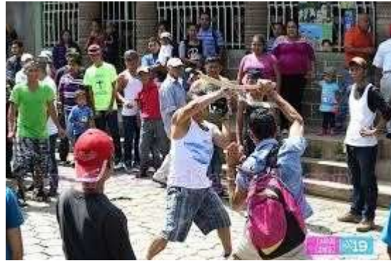
tradicional juego de astillas,16-07-17

Diría es una región sumamente tradicional y religiosa. Desde siempre ha tenido costumbres muy arraigadas y peculiares. La estructura religiosa de los indios mangués era la misma estructura religiosa que se maneja en toda América, es decir desde México hasta Nicaragua, creían en los