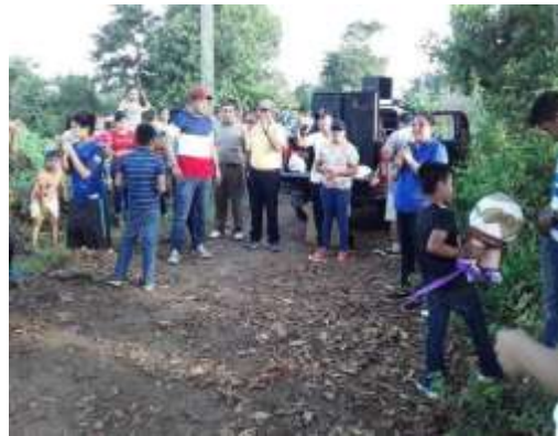
Fuente: Alcaldía Municipal, recreación para niños y población en general, 14-11-20

Los espacios de recreación social del adulto mayor en la comunidad son muy pocos los dirigidos hacia este grupo, sin embargo, donde hay más actividades dirigidos a estos son en las zonas urbanas donde hay asilos de ancianos que se encuentran abandonados por sus familiares y es ahí donde la alcaldía destina