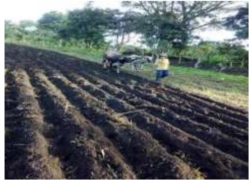
Fuente: tomada por autor de monografía, realización de rayado de tierra para sembrar, 26-10-20

Seguidamente cuando se aproxima el periodo de cosecha de primera los agricultores de esta comunidad (adultos mayores) estos empiezan a limpiar las fincas con el objetivo de ir preparando ya la tierra donde se va a cosechar los granos básicos, para estas labores algunos adultos buscan a mozos para que les ayuden a realizar estas actividades de preparación de los terrenos, luego ya una vez preparado