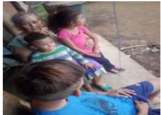
adulta mayor con sus nietos, 02-11-20

El adulto mayor de las zonas rurales en este caso específico, en la comunidad “losJirones” tienen diferentes prácticas cotidianas ya que estos son quienes relatan las diferentes historias que han pasado durante su trayecto de vida en la comarca y se las inculcan a sus hijos, nietos y sobrinos, con el objetivo de relatar la historia de la comunidad de