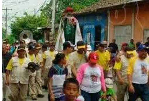
Fuente: google.com.ni, recorrido tradicional de san pedro apóstol en el municipio,16-07-17

El sagrado corazón de Jesús entre otros. Con más de 300 años de fervor religioso y tradición,