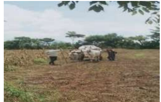
recolección de cosecha de maíz en el campo,07- 01- 2019

una vez realizado todo este proceso ya antes mencionado llega el periodo de recolección de las cosechas realizadas en la temporada, aquí los adultos mayores requieren