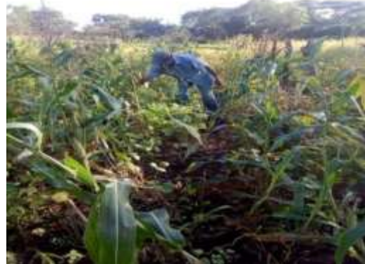
revisión de cosecha para realizar levantamiento de esta, misma, 28-11-20

La mayoría de los adultos de esta comarca por lo general requieren de una mano de obra extra para realizar sus actividades en el campo en el cual estos disponen de una cierta cantidad monetaria para pagar esta mano de obra contratada para que les ayude a hacer más