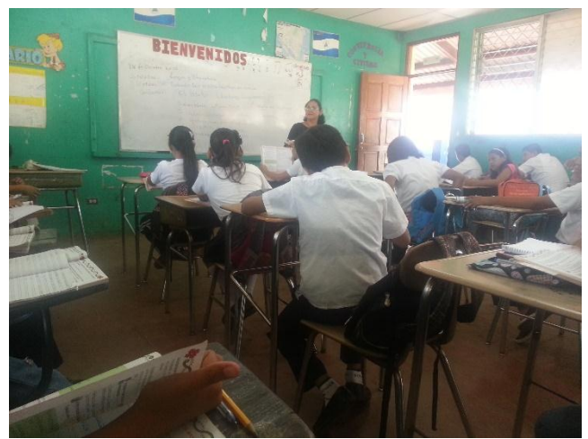
Imagen No 5 y 6 Preguntas de comprensión post lectura

Extrajo enunciados del texto leído para explicar el concepto de hiato a través de ejemplos, luego escribió el concepto en la pizarra y mientras los alumnos transcribían ella terminaba de revisar tarea en casa da manera individual pero la mayoría no cumplió con la tarea. Asignó ejercicios de identificación de hiatos que