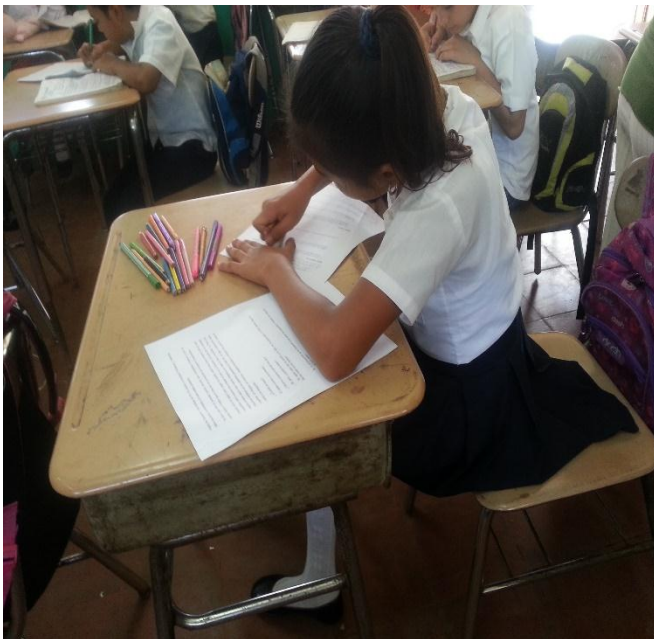
Imagen N10 Realización de prueba de aplicación

Para conocer los niveles de comprensión lectora que poseen los estudiantes de quinto grado se aplicó un test de comprensión lectora el día 05 de Noviembre, el test fue aplicado a 15 estudiantes(a) cuya edad oscila entre 10 y 14 años siendo ellos la muestra de una población de 35 alumnos. La mayoría de los estudiantes de la muestra es de sexo femenino.