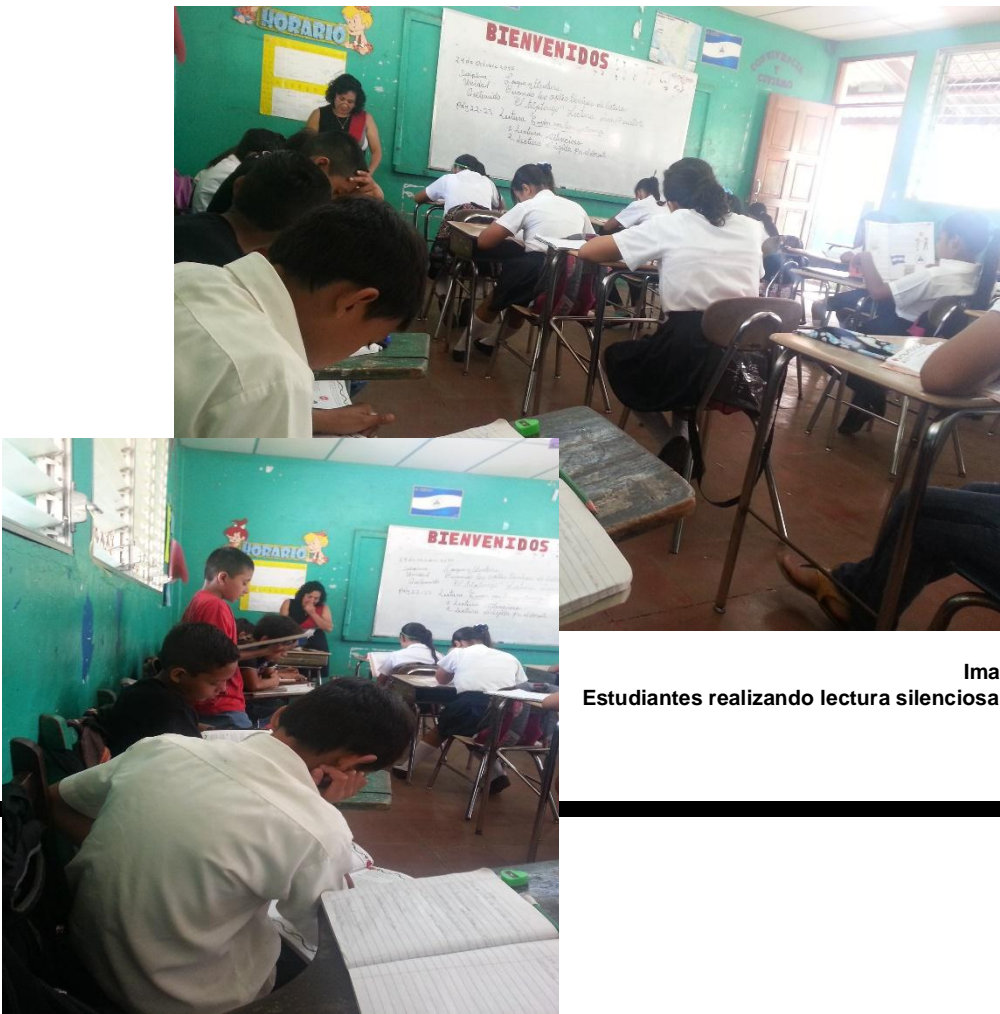
Imagen No 7 Estudiantes realizando lectura silenciosa

Presentó el contenido y asignó a los estudiantes ubicarse en la página 22 del libro de Lengua y Literatura para leer el texto “Todos nos comunicamos”. Antes de comenzar a leer realizó exploración a través de las imágenes presentes en el texto, la mayoría de estudiantes expresaron sus ideas y posteriormente orientó lectura silenciosa.