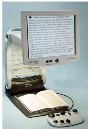
Lupa TV.