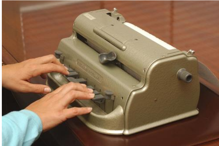
Máquina Perkins.