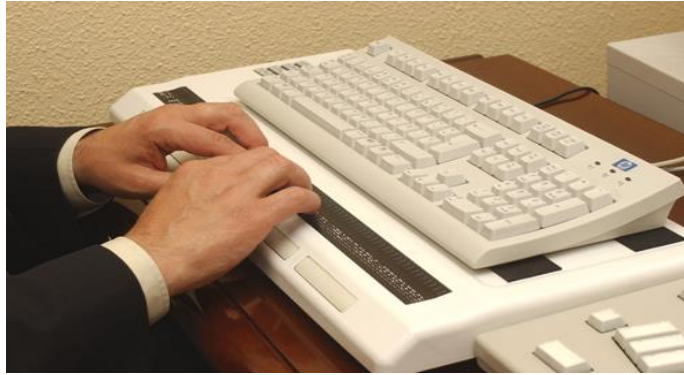
Línea braille.