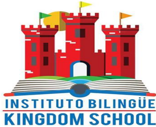
Foto34 logo del centro