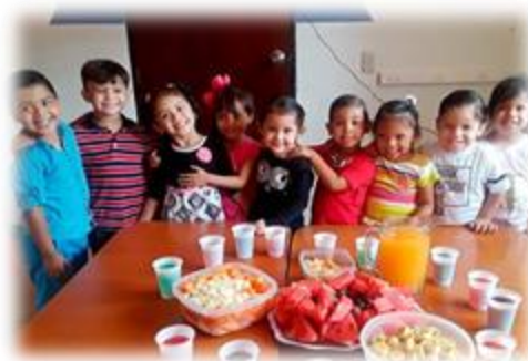
Foto 27. Campaña alimentación saludable.

Es por eso, que también el centro gestiona campañas de información sobre el dengue, alimentación saludable, el deporte, trabajo en equipo, al colegio con mis padres, entre otras. Todos estos proyectos se evidencian en el calendario anual con el que trabaja el centro escolar. Un calendario diseñado con apoyo de los docentes y en conjunto con la dirección.