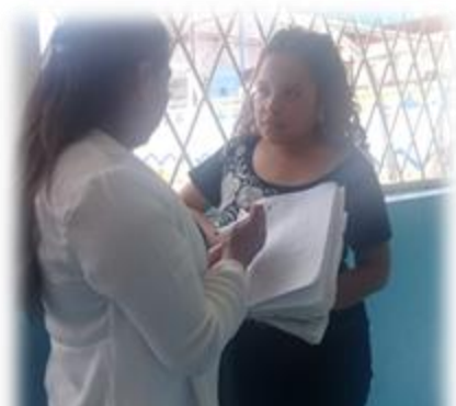
Foto 14. Entrevista a docente de primaria.

experiencia necesaria en cuanto al ambiente educativo que se desarrolla y al proceso de enseñanza aprendizaje, así que se considera una fuente de información de primera mano para esta investigación.