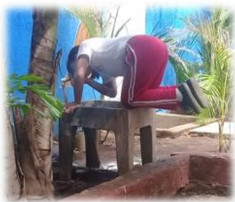
Foto 1. Falta de bebedero dentro del centro.

En el instituto Kingdom School ubicado en Managua distrito IV a través de un diagnóstico realizado a las instalaciones del centro educativo se logra observar que existe una problemática en cuanto a la falta de bebederos de agua potable, ubicados en distintitos puntos del patio del colegio.