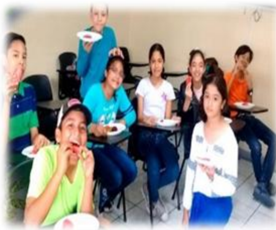
Foto 23. Almuerzo en el aula.

c. Ampliar el comedor para los estudiantes. Ya que es poco espacioso para la cantidad de niños que almuerza. Están muy hacinados identifica la población en estudio. “Algunos niños no salen a comer afuera, se quedan en el aula de clase, en el mismo que pasan casi siete horas sentados, o buscan otros lugares en los alrededores, lo cual no es correcto”.