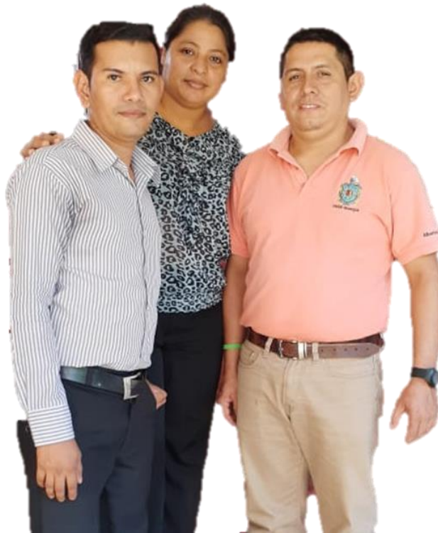
Foto 35. Equipo de investigación.