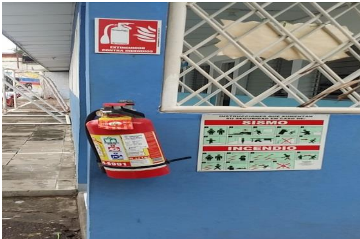
Foto32 extintor contra incendio