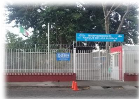
Foto 9. Entrada principal de Kingdom School.

El acceso del centro es por vehículo particular o por el recorrido del centro; lo que se torna un poco pesado a la hora de salida de preescolar ya que la calle se congestiona, pues ésta también se comparte con los recorridos del Colegio María Luisa de Marilac, ubicado frente a este centro.