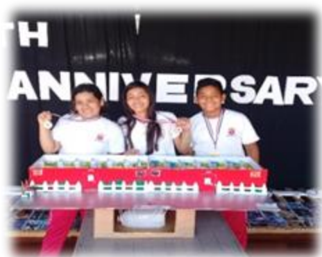
Foto 18. Pprimer lugar en la Feria Científica 2019.

Para este año, pese a esta situación, Kingdom School se propuso desarrollar nuevos proyectos en infraestructura que beneficiaran el ambiente escolar de los estudiantes y dedicó su 10 aniversario a la presentación de perfiles de proyectos por parte del estudiantado para la selección de su ejecución.