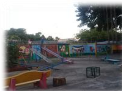
Foto 7. Patio del parque ubicado en Kingdom School.

Por las características del lugar (parque Los Sueños), su estructura es diferente a otros centros escolares. Dentro de sus instalaciones posee una clínica dental, cafetín, un área de juegos, canchas, panadería, consultorio psicológico abierto a la comunidad, biblioteca pública y dos pabellones de cuatro aulas cada una.