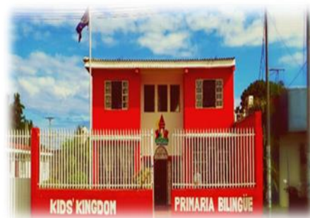
Foto 5. Segunda instalación de Kids Kingdom.

instalaciones de primaria, luego de dos años; quedando unificada las instalaciones