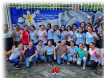
Foto 11. Parte del talento humano de Kingdom School.