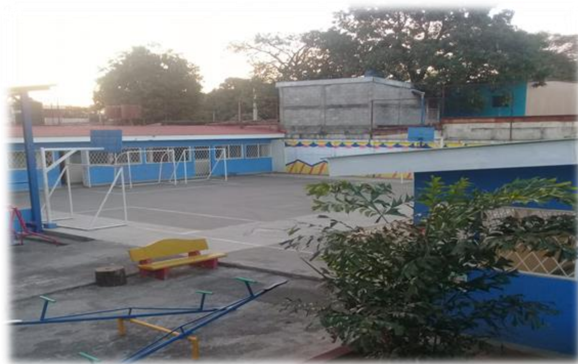
Foto 2. Instituto Kingdom School

GESTIÓN DE PROYECTOS QUE REALIZA EL EQUIPO DE DIRECCIÓN Y QUE INCIDE EN EL AMBIENTE ESCOLAR DEL INSTITUTO KINGDOM SCHOOL, UBICADO EN EL DEPARTAMENTO DE MANAGUA, DISTRITO IV, REALIZADO EN EL AÑO 2019.