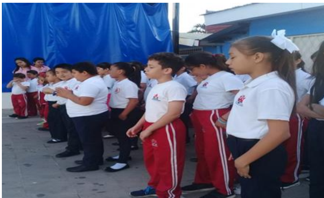
Foto 29. niños en acto cívico