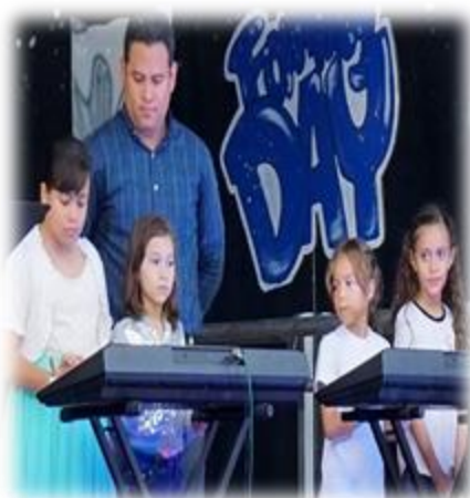
Foto 24. Presentación de la clase de música.

“Cuando yo me vine a matricular, el año pasado que se estaba abriendo la secundaria, a mi papá le dijeron que tenían clases de danza y música, las cuales se recibían dos veces por semana; pero cuando entré me di cuenta que tenían un costo extra de 10 dólares cada una, aparte del costo de mensualidad, que es considerable”, expresó una de las estudiantes, la cual fue respaldada por el grupo.