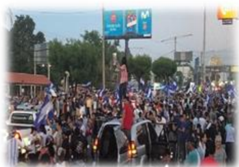
Foto 17. Protesta de la sociedad civil. Abril 2018

A partir del 18 de abril del 2018, en Nicaragua se ha desarrollado una crisis sociopolítica en nuestro país, que dificulta la inversión en proyectos de infraestructura. Según la empresa privada, se presentó una inflación de 3.25%, lo que implicó en que muchas de estas cerraron operaciones.