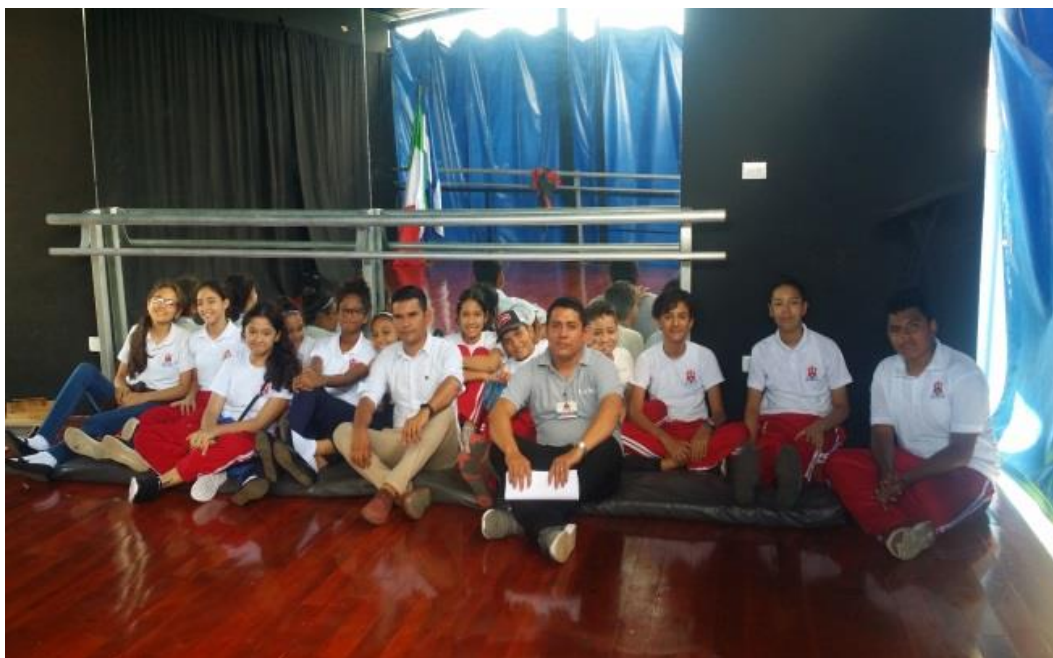
Foto 30 Grupo focal