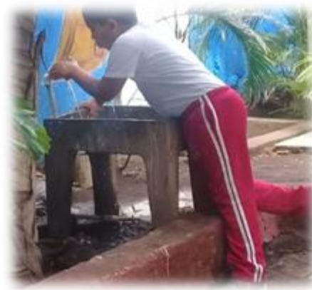
Foto 20. La necesidad de un bebedero es apremiante.

Como investigadores y analistas de la situación presentada, coincidimos con los involucrados que manifiestan que en estos 18 meses de haberse trasladado a esta instalación se identifican ciertas necesidades, que de no dárseles prioridad en los próximos meses vendrían hacer de gravedad para la comunidad estudiantil.