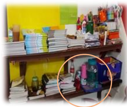
Foto 21. Depósito de agua de un aula de preescolar.

depósitos de agua que las docentes mantienen en el aula de clase. Sin embargo, en las instalaciones del centro no existen bebederos que le permitan a los estudiantes satisfacer sus necesidades de manera higiénica, ya que toman de los dos lavaderos de lampazos que las conserjes tienen para uso de la limpieza del centro.