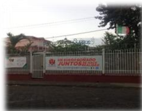
Foto3. Entrada principal de Kingdom School

El escenario de la investigación corresponde al Instituto Kingdom School, distrito IV de Managua, Barrio Larreynaga, con una micro localización de los semáforos del puente El Edén 4 cuadra al Oeste, 2 cuadras al Norte, ½ cuadra al Oeste; en el parque Los Sueños.