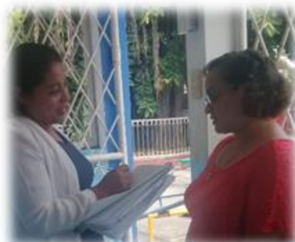
Foto 15. Entrevista a docente de preescolar.

Las docentes son fuente de información primaria para el presente estudio, ya que están inmersas en el ambiente escolar dirigiendo el proceso de enseñanza y aprendizaje; también, conviven a la par del estudiante en igual condiciones en su ambiente escolar.