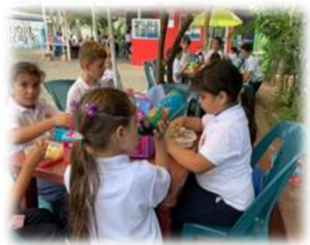
Foto 12. Estudiantes almorzando en el centro.

Esta última se encarga de preparar los alimentos del desayuno y el almuerzo de los estudiantes.