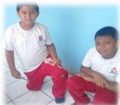
Foto 22. Buzos dañados por las caídas en el patio.

b. El readoquinamiento del área recreativa. Este centro está todo adoquinado, sin embargo, algunos se encuentran a un nivel superior que otros, lo que provoca accidentes frecuentes entre los estudiantes que corren por las instalaciones. “Es moda Kingdom que los estudiantes tengan rotos los uniformes de las caídas que se dan”.