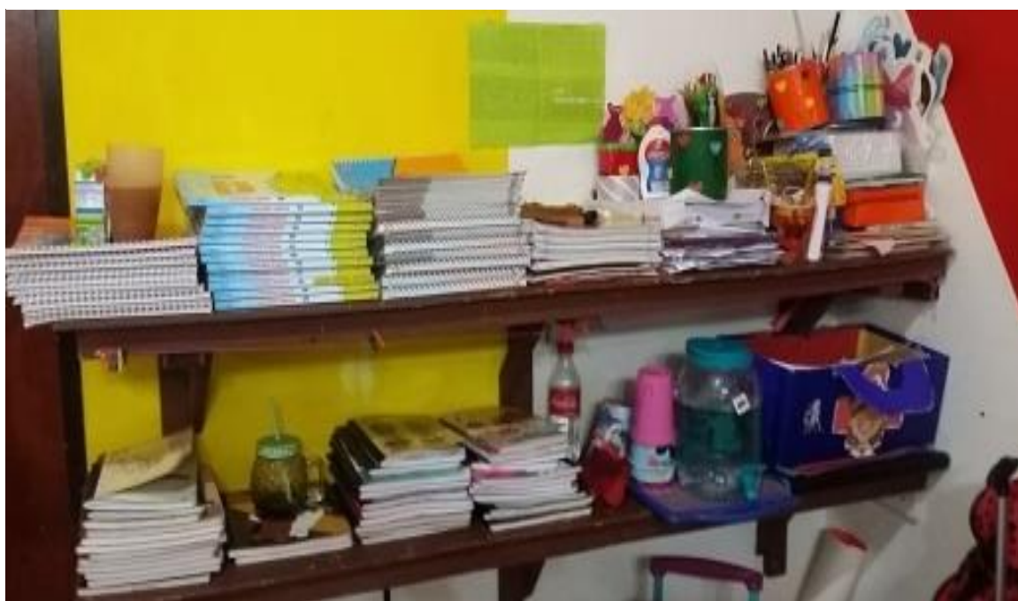
Foto 33 libros de texto