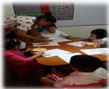
Foto 10. Maestra de After School.

En la modalidad de primaria y secundaria se trabaja bajo el mismo sistema, una docente para las materias en idioma español y una docente para las materias en inglés. Estos reciben un horario de clase de siete de la mañana a las dos de la tarde; por lo que los estudiantes reciben clases como, Reading, Math, Science e History en el idioma inglés; lo que podría ser la mayor fortaleza en su oferta académica; además de las básicas del currículo nacional.