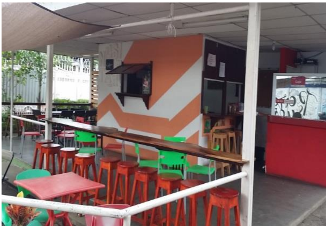
Foto 31 cafetín del colegio