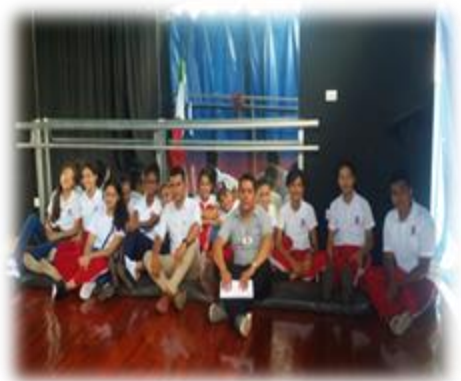
Foto 16. Estudiantes que participaron de la selección del grupo focal.

Se seleccionó una muestra de estudiante de sexto, séptimo y octavo grado que cumplieran con el requisito de haber estudiado por lo menos cuatro años en este centro de estudio, reuniendo 8 estudiantes para la realización de un grupo focal, ya que ellos tienen la experiencia vivida sobre las condiciones en que se desarrollan.