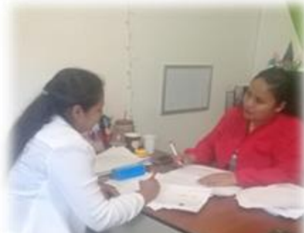
Foto 13. Directora Académica de Kingdom School.

A la directora del centro educativo por ser el informante clave en el proceso educativo, y quien además es la creadora de este proyecto educativo, por lo que se estima que tiene la