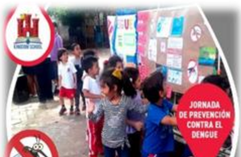
Foto 4. Niños desarrollan campaña contra el Dengue.

A media cuadra del centro, se encuentra un centro de salud con el que trabajan de la mano, en las diferentes campañas de salud que desarrolla el Ministerio de Salud, durante la permanencia de los investigadores se observó a los estudiantes desarrollando campañas contra el Dengue.