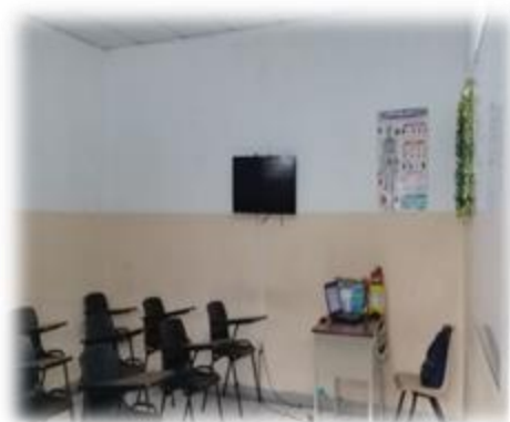
Foto 8. Aulas de primaria Kingdom School

Posee muro perimetral en toda su instalación. En la pared derecha del centro se encuentra un portón que comunica con las instalaciones de preescolar y maternal, con el objetivo que esta área sea más segura para los y las estudiantes. Ambas plantas están debidamente señalizadas con las rutas de evacuación, lo que permite realizar de forma satisfactoria los simulacros ante desastres naturales, asimismo la evacuación de los niños en caso de emergencia.