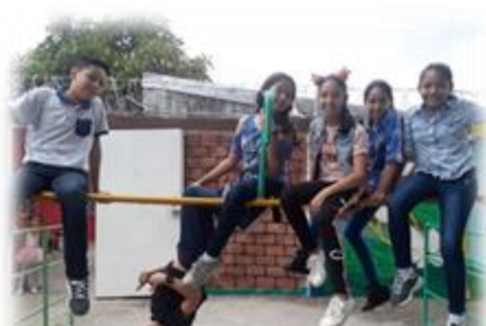
Foto 19. Estudiantes desarrollan habilidades psicomotrices.

En Psicología, una necesidad es un impulso surgido de un estado de tensión debido a una carencia concreta. Procede del latín necessitas , -ātis . Puede definirse como el estado de una persona en relación con los medios necesarios o útiles para su existencia y desarrollo. Por consiguiente, es necesario la clasificación de las necesidades según orden de prioridad.