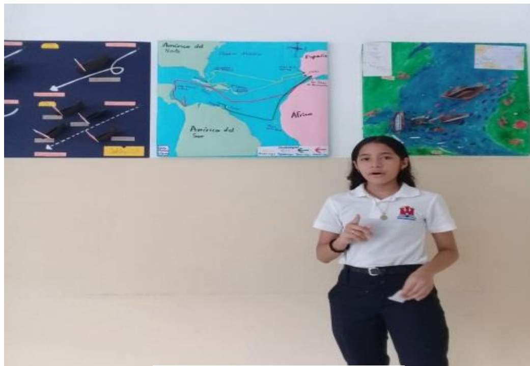
Foto 28 Niña exponiendo