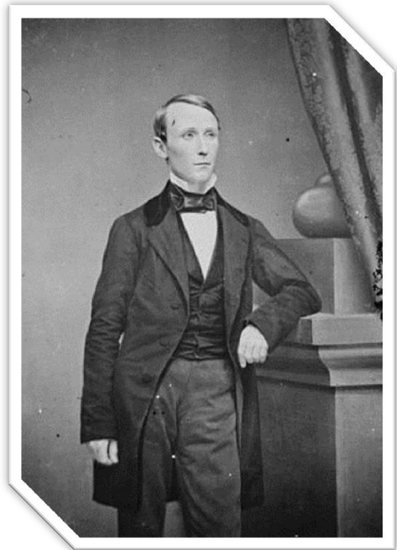
William Walker, filibustero Estadounidense.

William Walker fue una figura interesante en la política nicaragüense. Tenía delirios de grandeza, hasta el punto de declararse presidente del país después de ganar algunas batallas, el filibustero estadounidense fue derrotado en una batalla importante en San Juan del Sur, se le ordenó derrocar al gobierno legítimo en Rivas y navegó un barco con más de 150 hombres y desembarcó en la playa ahora conocido como Gigante el 27 de junio de 1854, a partir de ahí comenzó su marcha hacia Rivas, bajo lluvias torrenciales, al enterarse de la inminente invasión del general Corral envió al