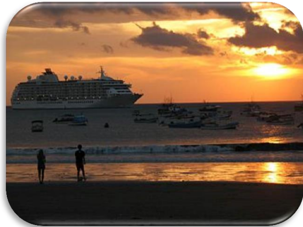
Recibimiento de cruceros