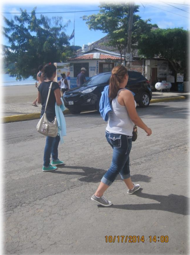
Recorriendo las calles del Municipio