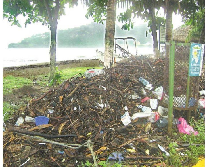
Basura Generada por turistas que visitan el municipio