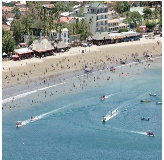
Embarcaciones que contribuyen a la contaminación del océano con la generación de residuos de aceites y gasolina