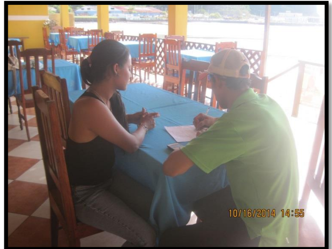
Integrantes del Grupo Aplicando Encuestas