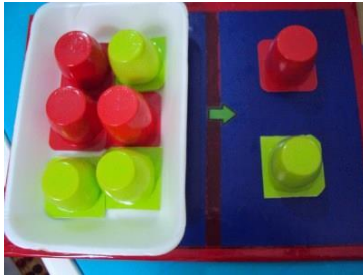
Agenda de rutina de un niño con autismo