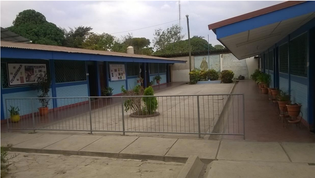
Escuela Monseñor Antonio Madrigal y García