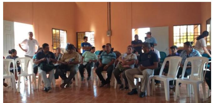
encuentro de productores en la Cooperativa.