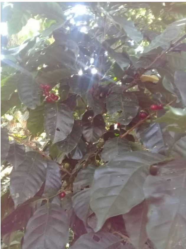
planta de café comienza a tener los primeros granos, Comunidad Darayli, Condega.