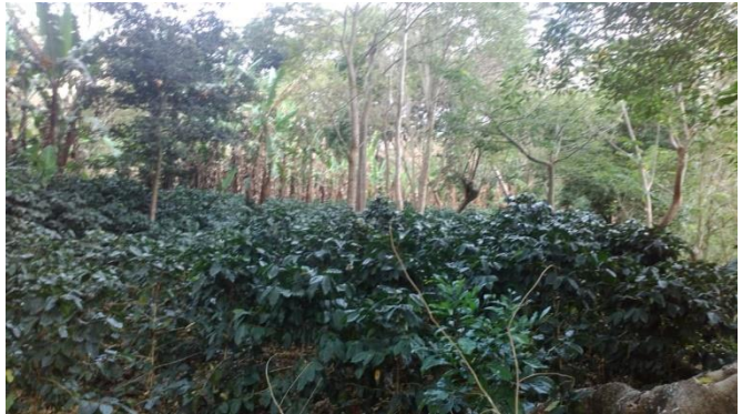
Fuente: Propia, Plantíos de café de los socios de la Cooperativa en la Comunidad el Jocote.