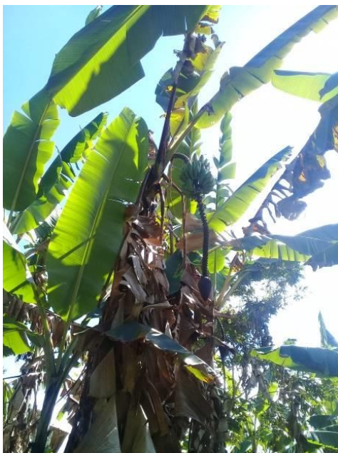
Fuente: Propia, plantas destinadas para sombra del café y para consumo propio.