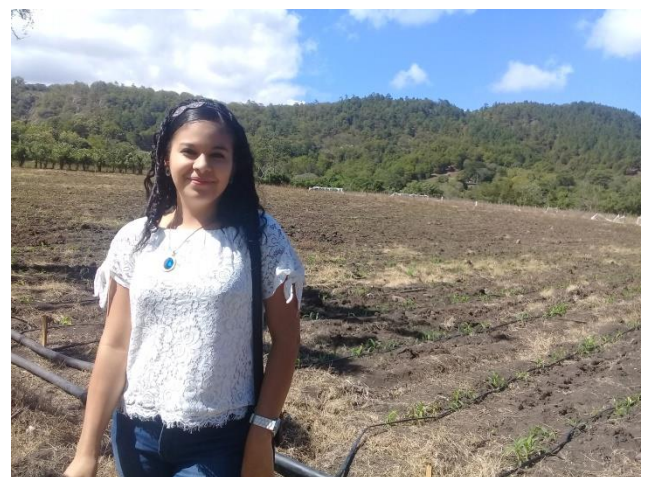
en esta área el socio realiza cosecha de Maíz y Frijoles, en la comunidad de Darayli, Condega.