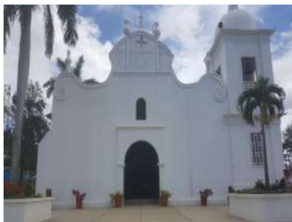
Ilustración 8 Iglesia San Pedro

Este artículo se basa en la investigación titulada Estrategias de Marketing para la promoción de la artesanía del municipio de Mozonte, departamento de Nueva Segovia en el periodo 2018-2019. Para obtener el título de Licenciatura en Turismo Sostenible de la UNAN-Managua, FAREM-Estelí. UNAN-Managua FAREM-Esteli, Correo Electronico: danny.sustainabletourism@gmail.com UNAN-Managua FAREM-Esteli, Correo Electronico: keniasustainabletourism@gmail.com UNAN-Managua FAREM-Esteli, Correo Electronico: elizanyelamoreno60@gmail.com