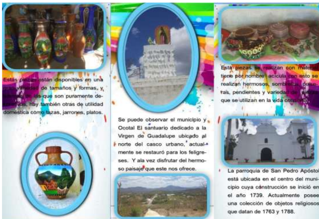
Ilustración 6 Brochure adentro