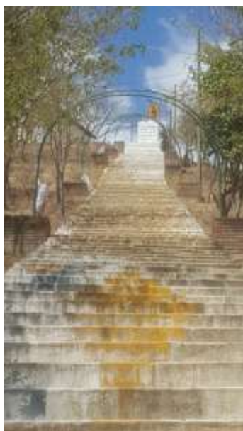
Ilustración 9 Loma Santa