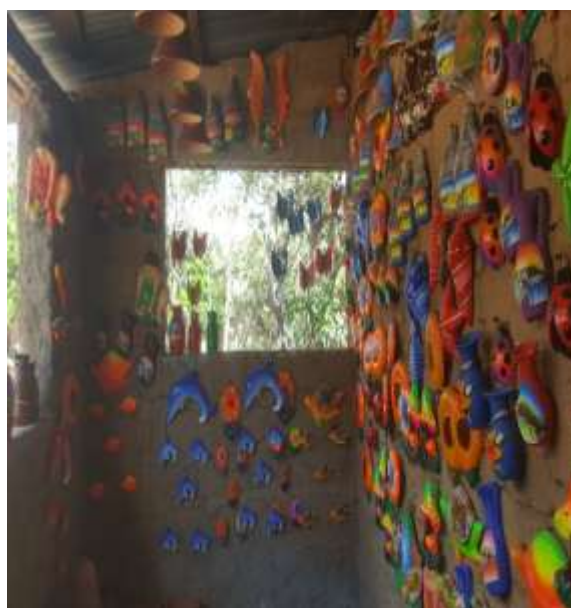
Ilustración 10 Artesanía en Barro