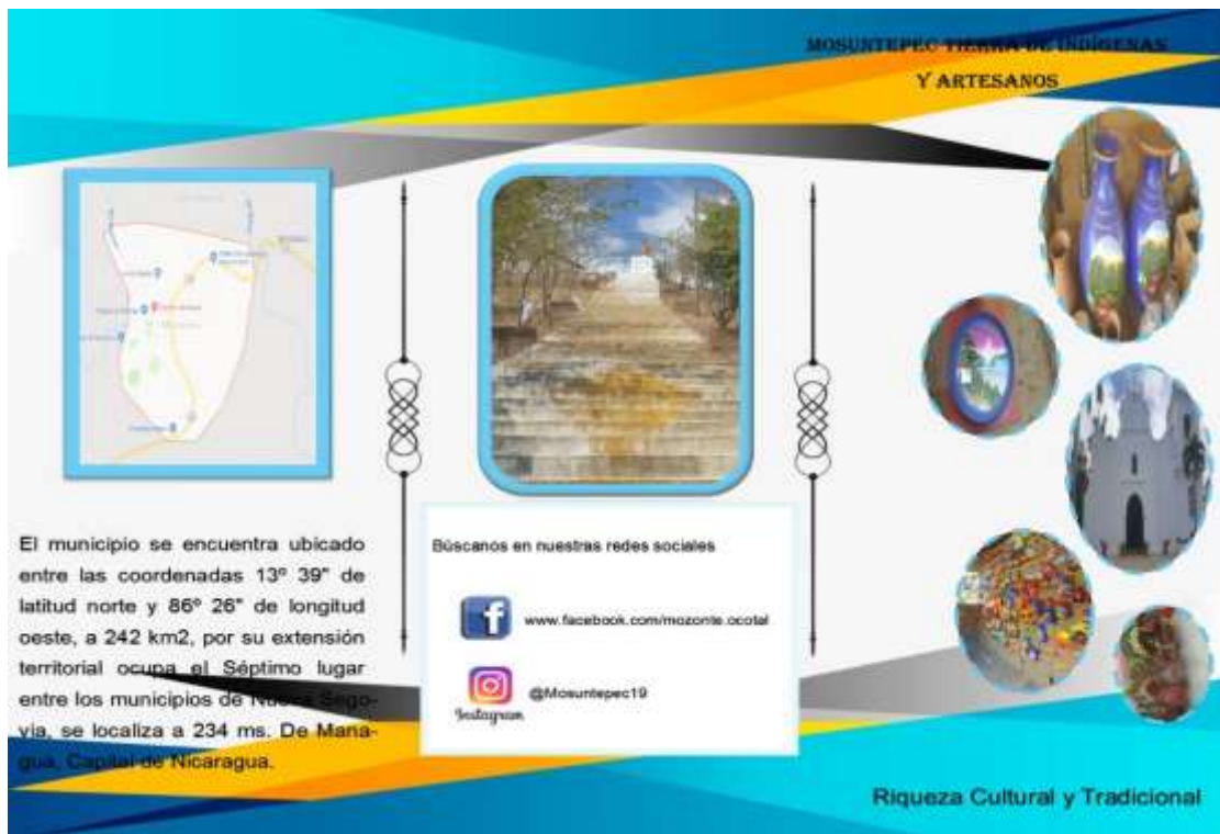
Ilustración 5 Brochure portada