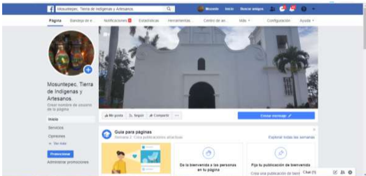
Ilustración 2 página de Facebook