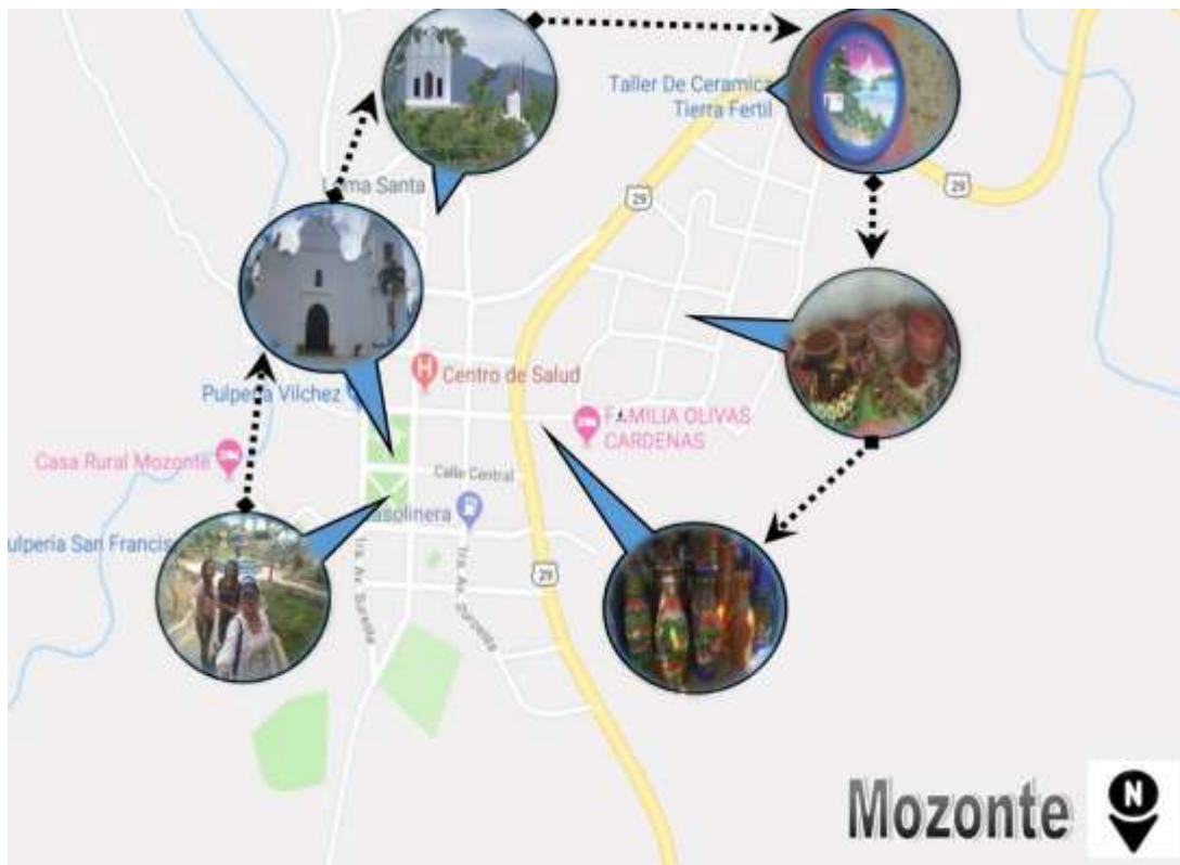
Ilustración 7 Circuito Turistico