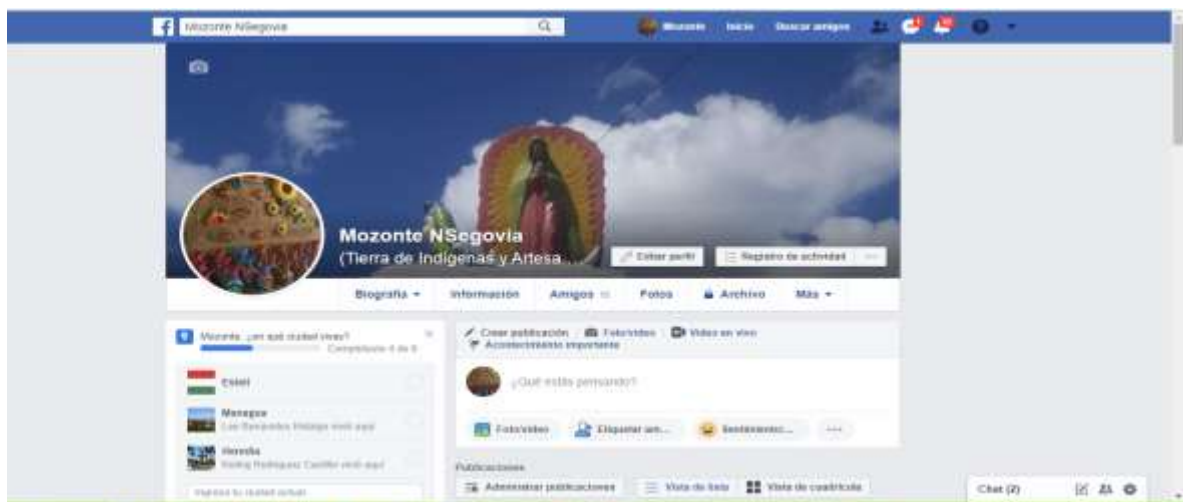
Ilustración 1 perfil de Facebook