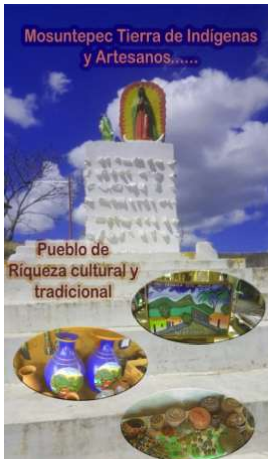
Ilustración 4 Banner

Este artículo se basa en la investigación titulada Estrategias de Marketing para la promoción de la artesanía del municipio de Mozote, departamento de Nueva Segovia en el periodo 2018-2019. Para obtener el título de Licenciatura en Turismo Sostenible de la UNAN-Managua, FAREM-Estelí. UNAN-Managua FAREM-Esteli, Correo Electronico: danny.sustainabletourism@gmail.com UNAN-Managua FAREM-Esteli, Correo Electronico: keniasustainabletourism@gmail.com UNAN-Managua FAREM-Esteli, Correo Electronico: elizanyelamoreno60@gmail.com