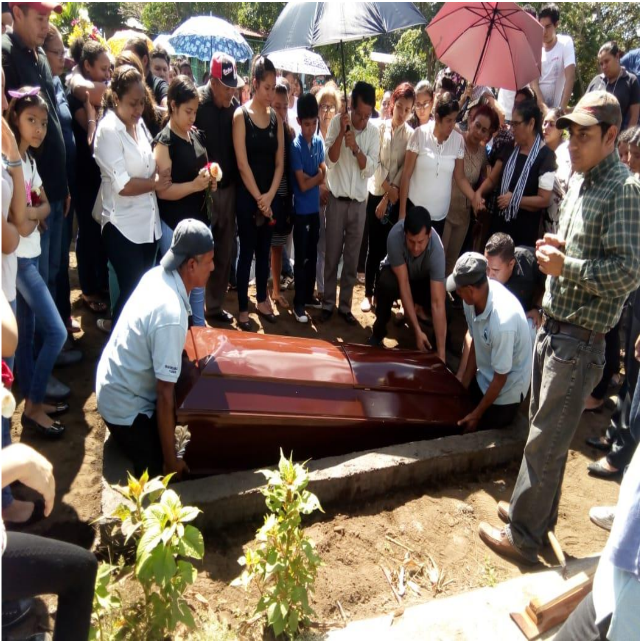
Fotografía número 5. Forma actual de entierro, horizontal de un cuerpo en el cementerio municipal de Ticuantepe.

Fotografía tomada por estudiantes de la tesis el día dieciséis de enero año dos mil diecinueve a las once de la mañana. Por estudiantes de la tesis. Se observó la forma de entierro, valoración del área sobre caducada.