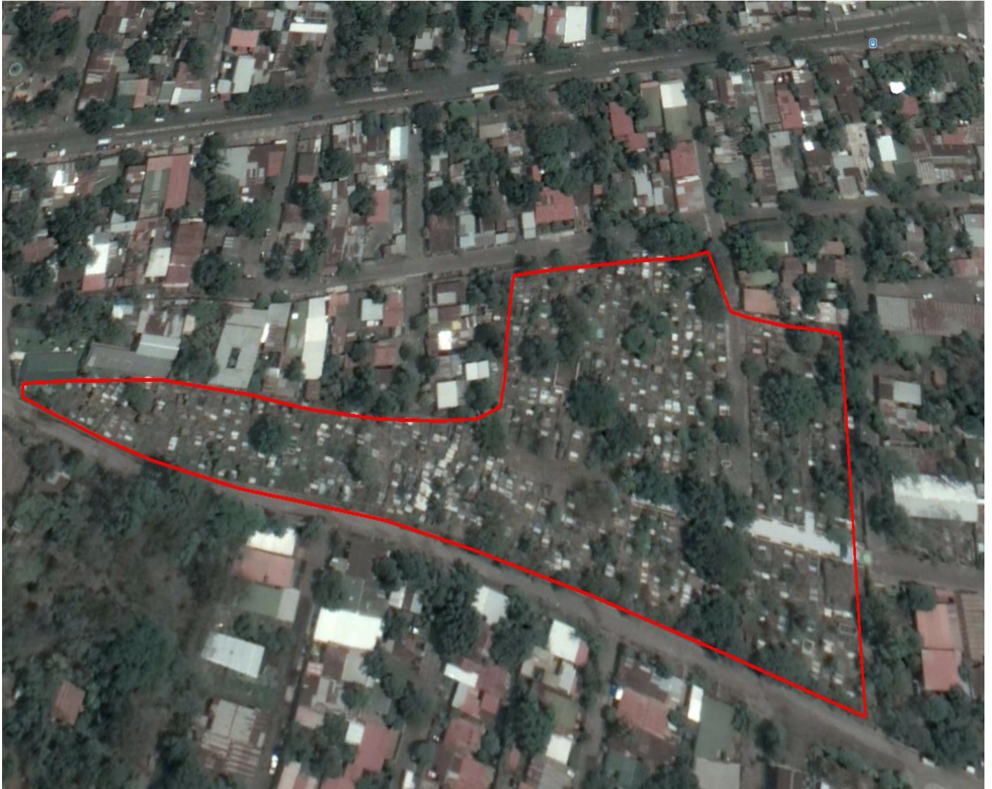
Fotografía.1. Imagen satelital del estado actual del cementerio municipal.

El día quince de octubre año dos mil dieciocho. El cementerio llegó al límite de su capacidad, su vida útil a caducado. Se evidencia violación a la NTON.