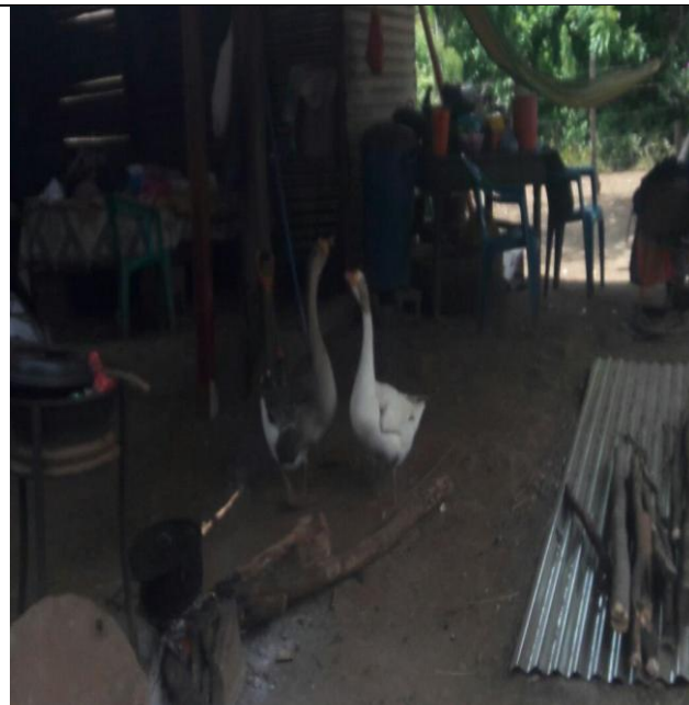
Aves de corral