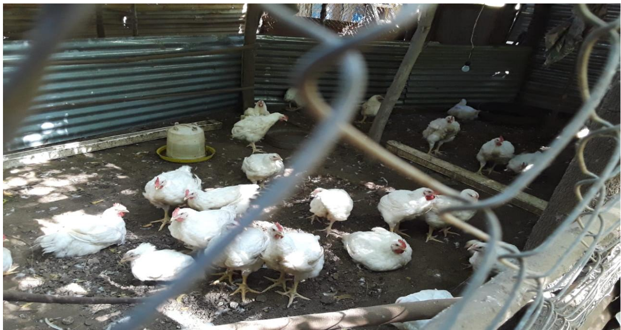
Producción de gallinas en la cooperativa Blanca Arauz

Por tanto se pasó de una comunidad desolada sin oportunidades de crecimiento hacia una comunidad generadora de trabajo familiar y cooperativo y alta productora de granos básicos y de cerdos y aves de corral