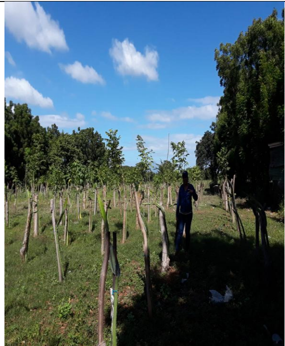
Campo de pitahaya