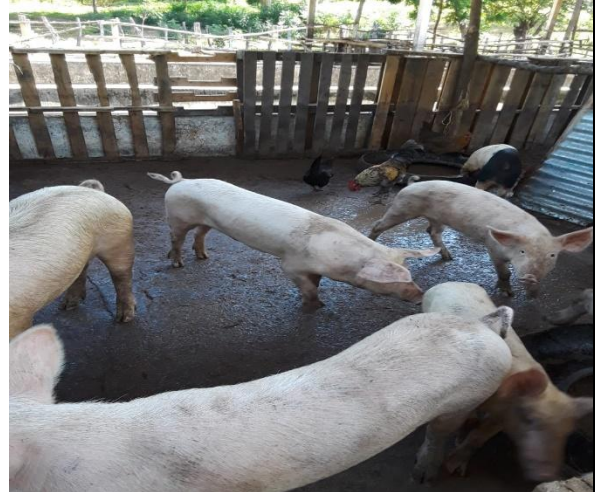
Crianza de cerdos