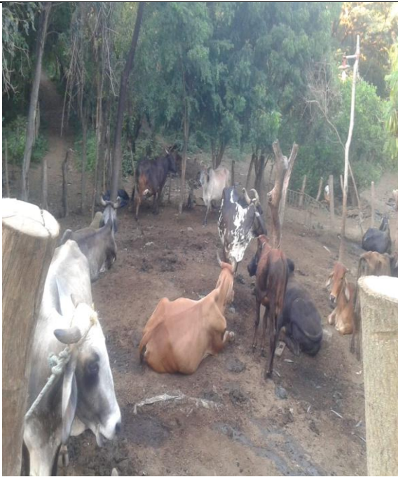
Reproducción de ganado