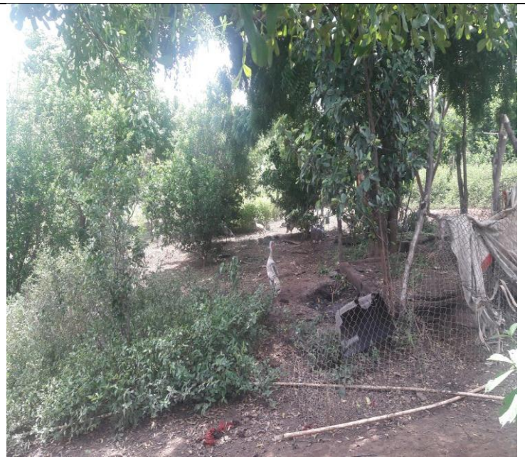
Desarrollo de aves de corral en la comunidad