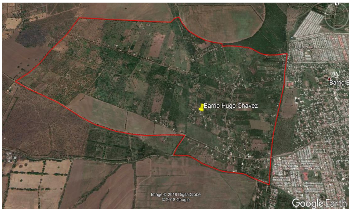
Mapa de la comunidad Hugo Chávez