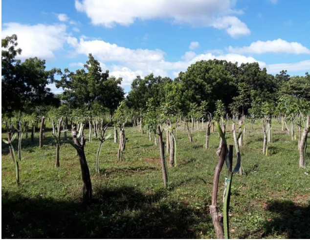
Sembradíos de Pitahaya