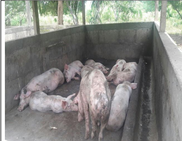
Desarrollo de granjas de cerdo en la comunidad