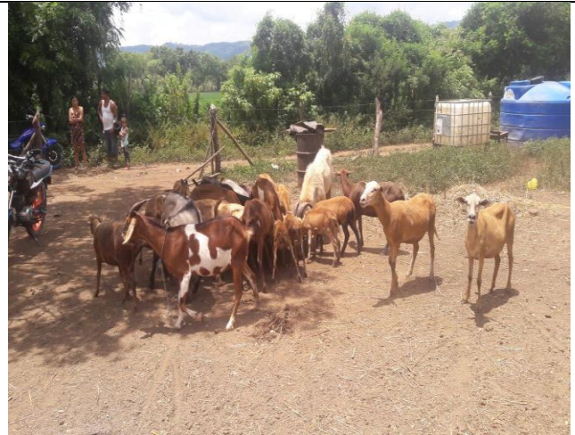
Ganado menor en la comunidad