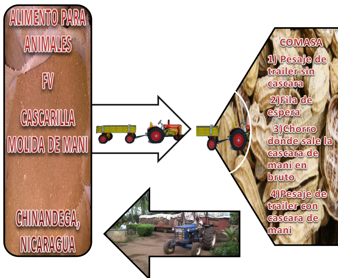
Figura 1: Proceso N° 1 / Elaboración Propia.