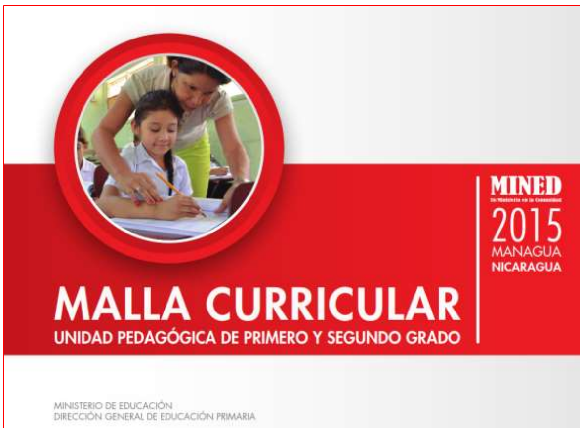
Portada de Malla Curricular 2015