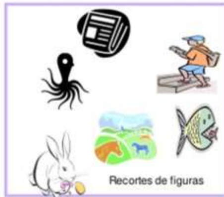
Recortes de figuras