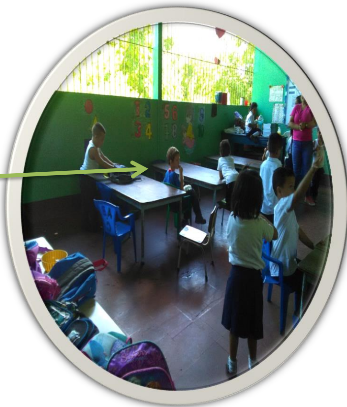
La docente al iniciar los cantos infantiles se evidencia al niño que no se integra en los cantos