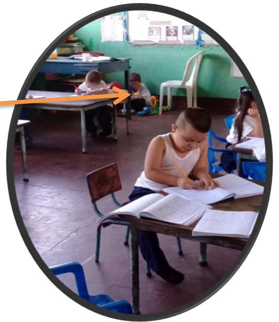
El niño en el tiempo de tareas y esta con los juguetes