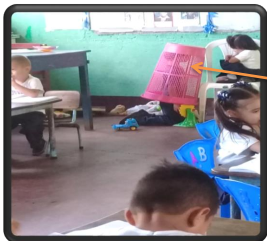
El niño haciendo su propio juego en horas de clases.