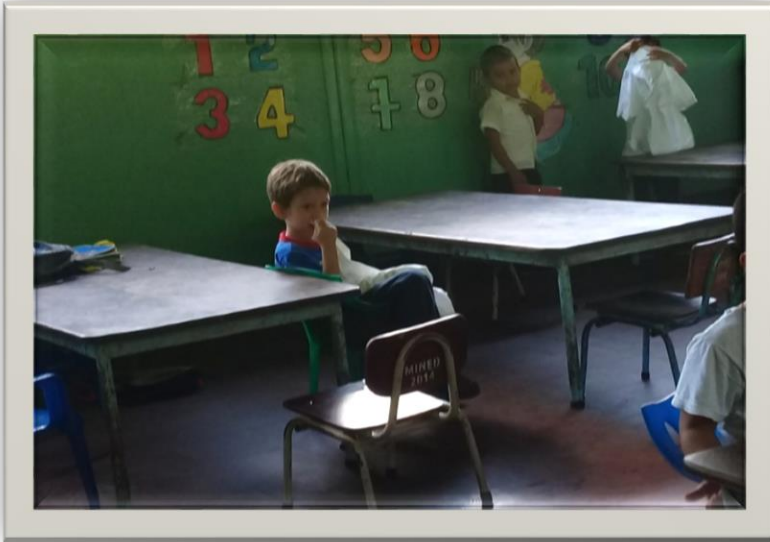
El niño fuera del grupo de trabajo