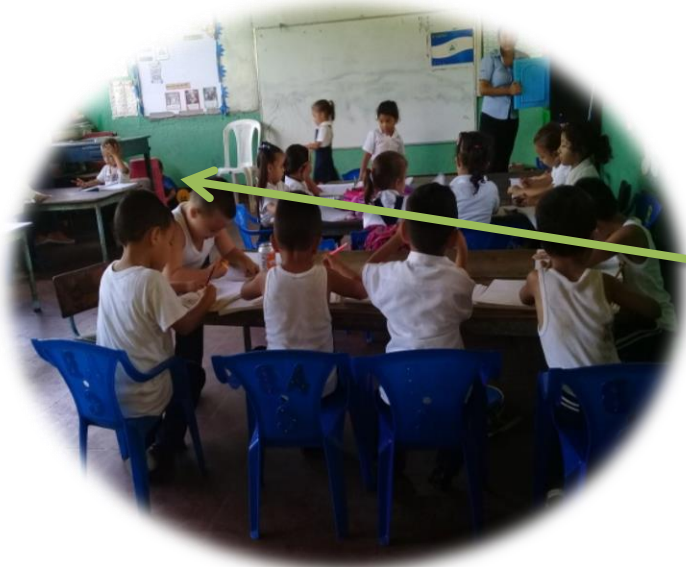
El grupo está trabajando y el niño en el rincón de la mesa